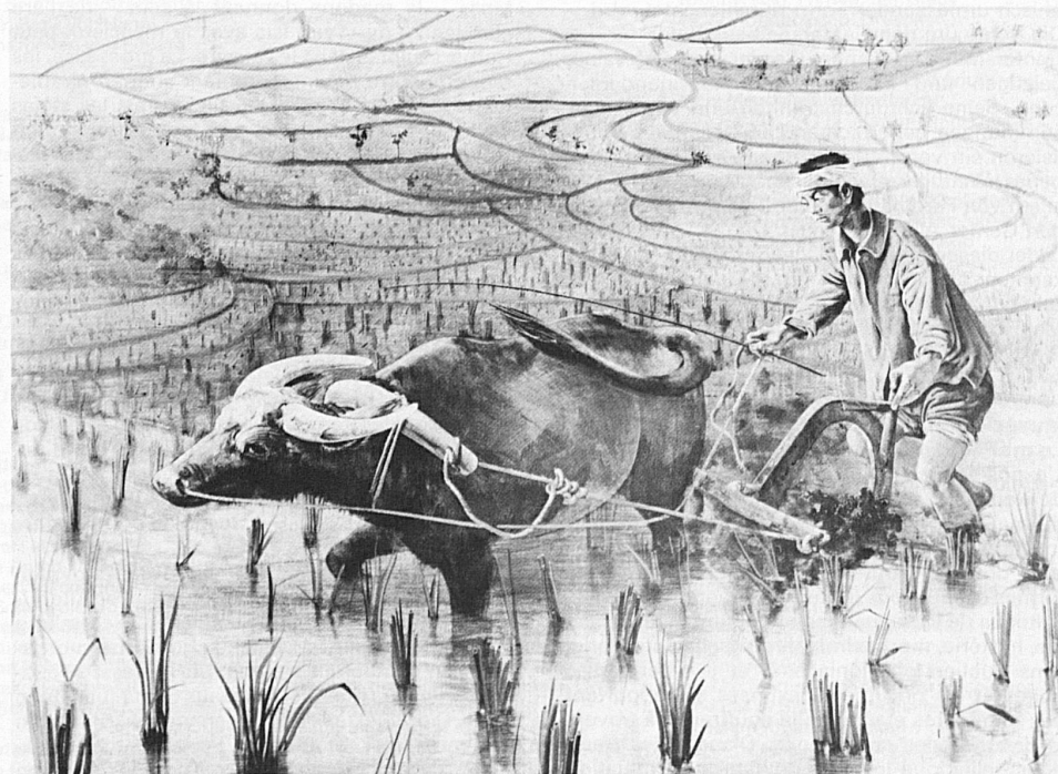
Begegnung in China: «Pflügen im Reisfeld», von Hans Erni (Acryl, 143 × 202 cm)

Die Ausstellung «Begegnung in China» umfasst gegen 100 Werke, unter anderem Tusche- und Temperabilder, der chinesischen Landschaftsmalerin Fu Yi-Yao und von Hans Erni, der eigens dafür auch einige extrem quer- und hochformatige Bilder schuf, wie sie für die chinesische Malerei charakteristisch sind. Vor einem Jahr hielt sich Hans Erni in China auf. Sein Erleben fand Niederschlag in einer Reihe von Werken, die nun, zusammen mit Bildern der chinesischen Künstlerin, vorgestellt werden. Ergänzt wird die Ausstellung durch einige Leihgaben des Museums Rietberg in Zürich. Bis 31. Mai