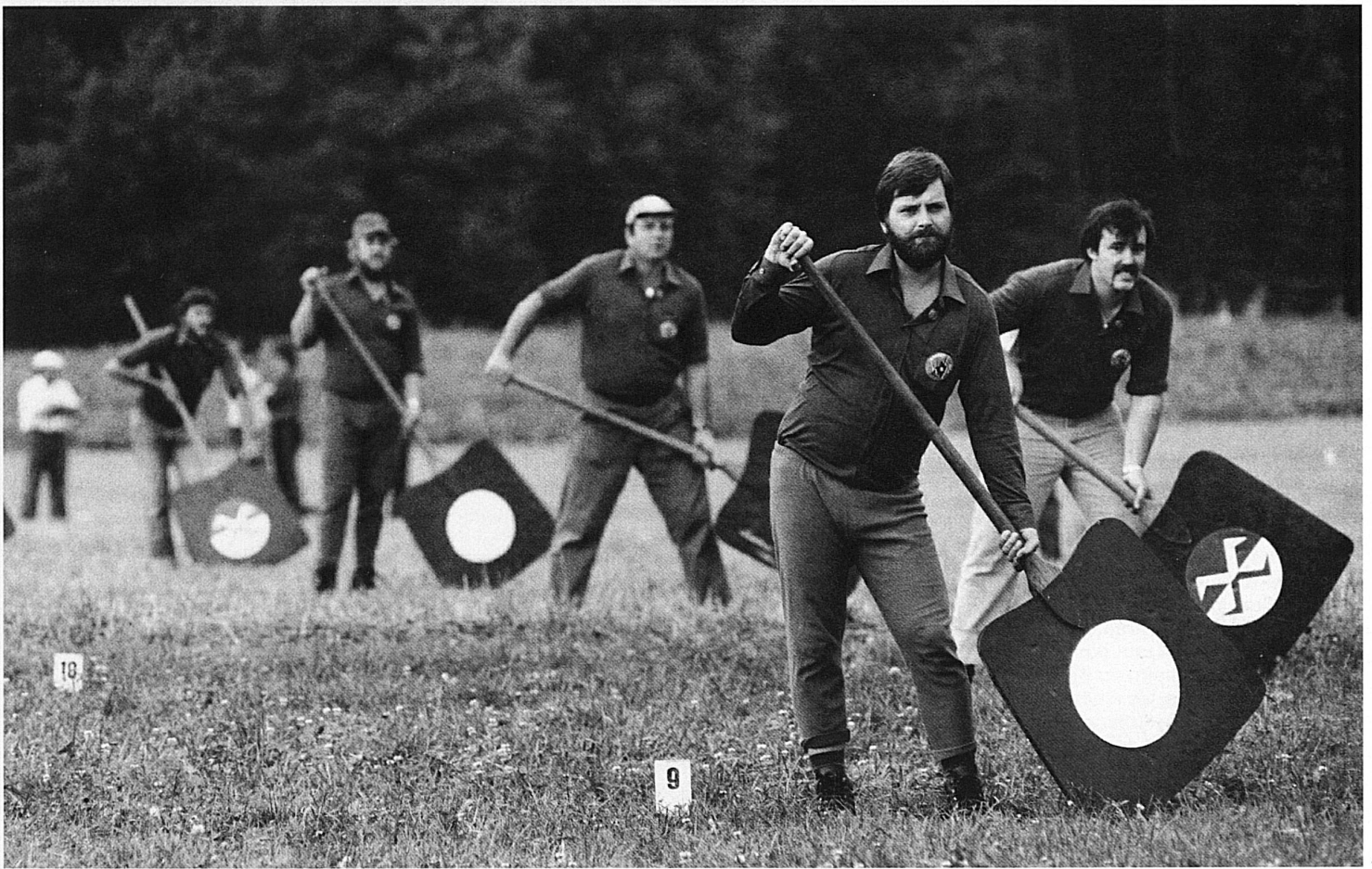
45-47 Die «Abtuer» müssen mit ihren Schindeln den Hornuss abfangen, bevor er zu Boden fällt. Dies erfordert grosse Geschicklichkeit, gilt es doch, erst einmal den Hornuss zu entdecken, weiter die Flugbahn richtig einzuschätzen, zur berechneten Stelle hinzurennen und dann mit «Stechen» – das heisst durch Hochwerfen der Schindeln – ihn endgültig abzubremsen. Gelingt dies nicht und geht der Hornuss im Ries ungebremst zu Boden, so erhält die abtuende Mannschaft «ein Numero», entsprechend einem Tor im Fussball