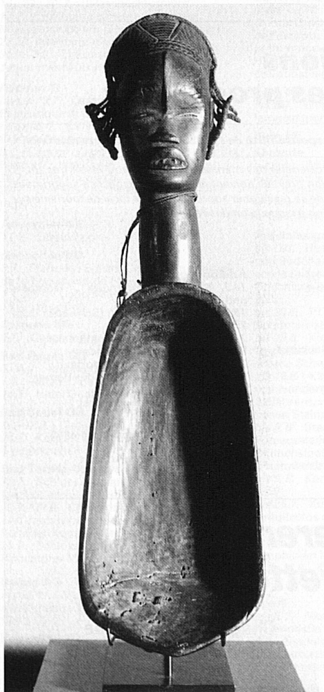
Löffel aus Westafrika, 60 cm

In der Abteilung Arts primitifs im Kunstmuseum Solothurn sind zurzeit Löffel aus verschiedenen Kulturen, vorab Afrikas und Asiens zu bewundern. Vereinzelt handelt es sich um Kultlöffel, in der Regel aber um gewöhnliche Gebrauchsgegenstände. Gerade an diesen Alltagsgegenständen zeigt sich der hohe Formwille dieser Kulturen. Mehrheitlich präsentieren sich die Löffelgrif-