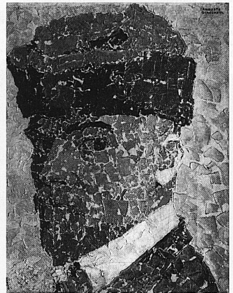
Augusto Giacometti: Selbstbildnis, 1910

In Giacomettis Werk spiegeln sich zunächst Einflüsse der Jugendstilkunst und des französischen Symbolismus. Er wurde in der Schweiz neben Ferdinand Hodler und Giovanni Segantini zum Hauptvertreter dieser Richtung. Mit seinen Mosaiken und Glasfenstern begibt er sich aber in die