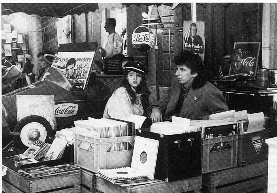
Brocante in Le Landeron: vom Kunstgegenstand zum Coca-Deckel

Zum 14. Mal führt Le Landeron am 26. und 27. September 1987 die zur Tradition gewordene Brocante durch. Der Markt ist durchgehend von 8 bis 19 Uhr geöffnet. Eine besondere Bedeutung kommt heute den zwischen den Weltkriegen industriell fabrizierten Gebrauchs- und Kunstgegenständen sowie Objekten aus den