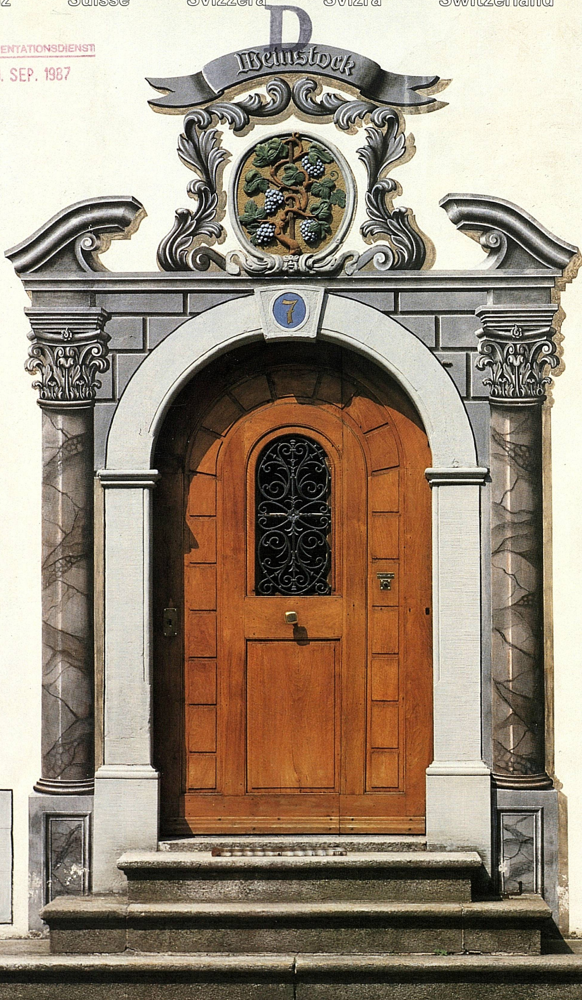
SCHERBHAUS DURCH DIE M 1976 RESTAUR SCHUTZ DER EIDGENOSSEN