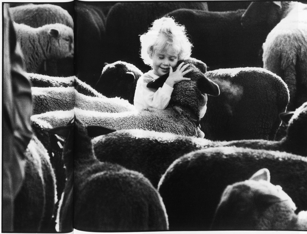
35 Rejoicing over the sheep that was lost