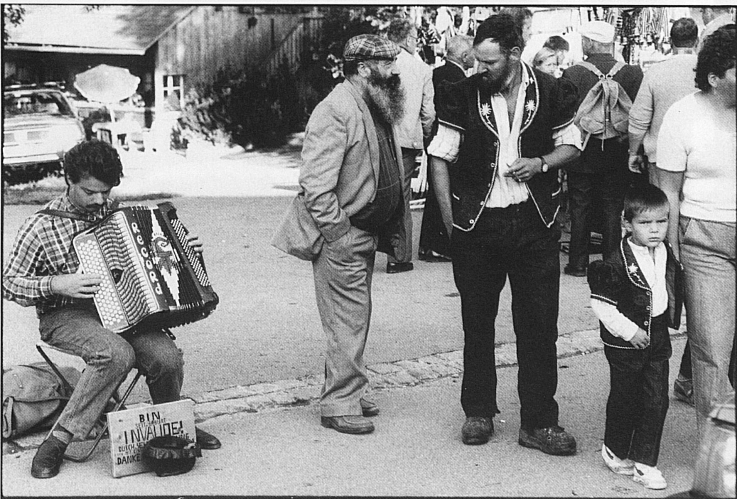
36–41 Marktstimmung in Riffenmatt, wo in der Früh die von der Sömmerungsalp zurückkehrenden Schafe geschieden, das heisst ihrem Besitzer zugeführt werden