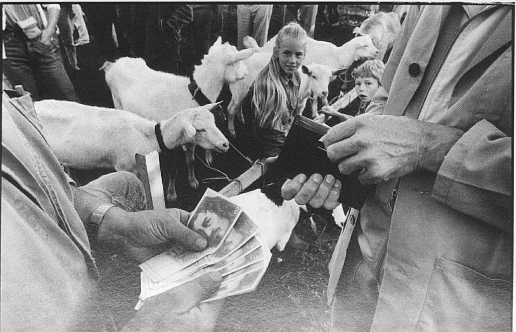
36–41 Ambiance de marché à Riffenmatt où, de bonne heure le matin, a lieu le tri des moutons revenus de l'alpage et restitués à leurs propriétaires