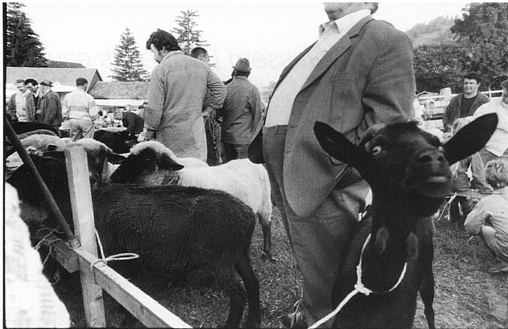
36-41 Atmosfera da mercato a Riffenmatt, dove di buon mattino le pecore rientrate dall'alpeggio vengono consegnate ai loro proprietari