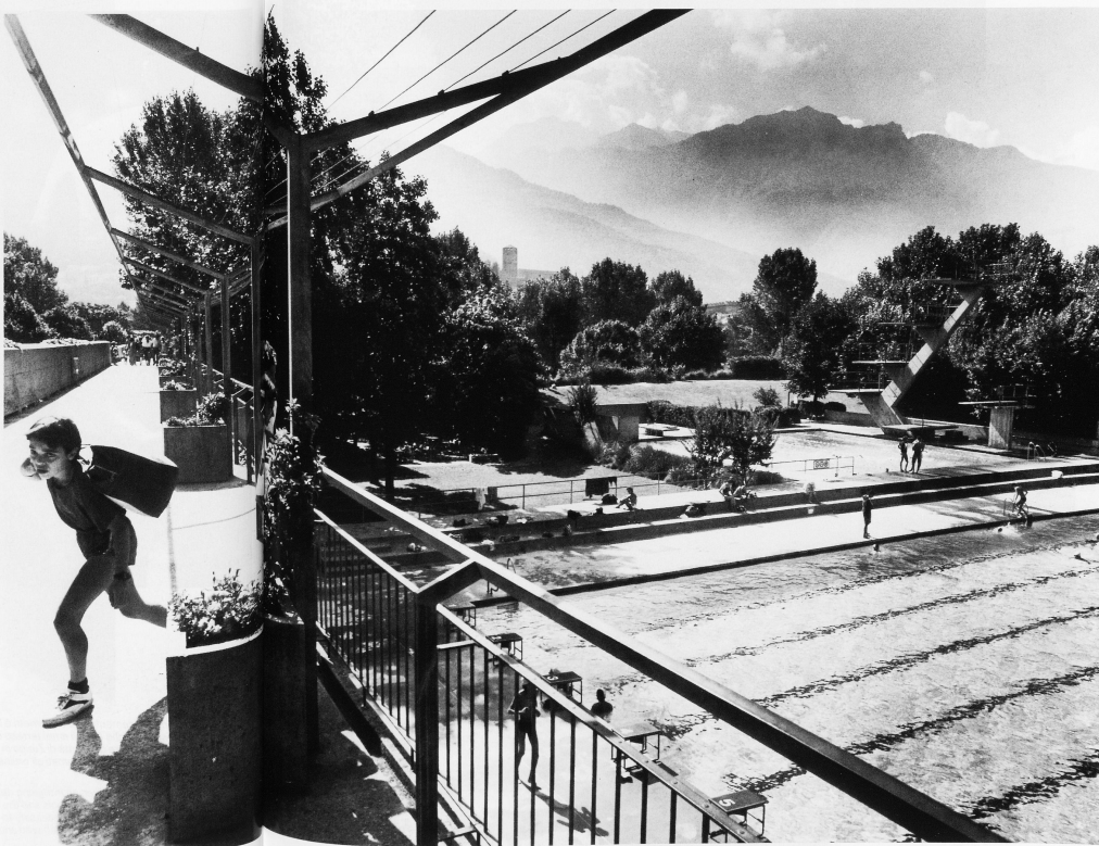
31 Schwimmbad Bellinzona / Piscine de Bellinzona / Bagno pubblico a Bellinzona / The open-air swimming pool of Bellinzona