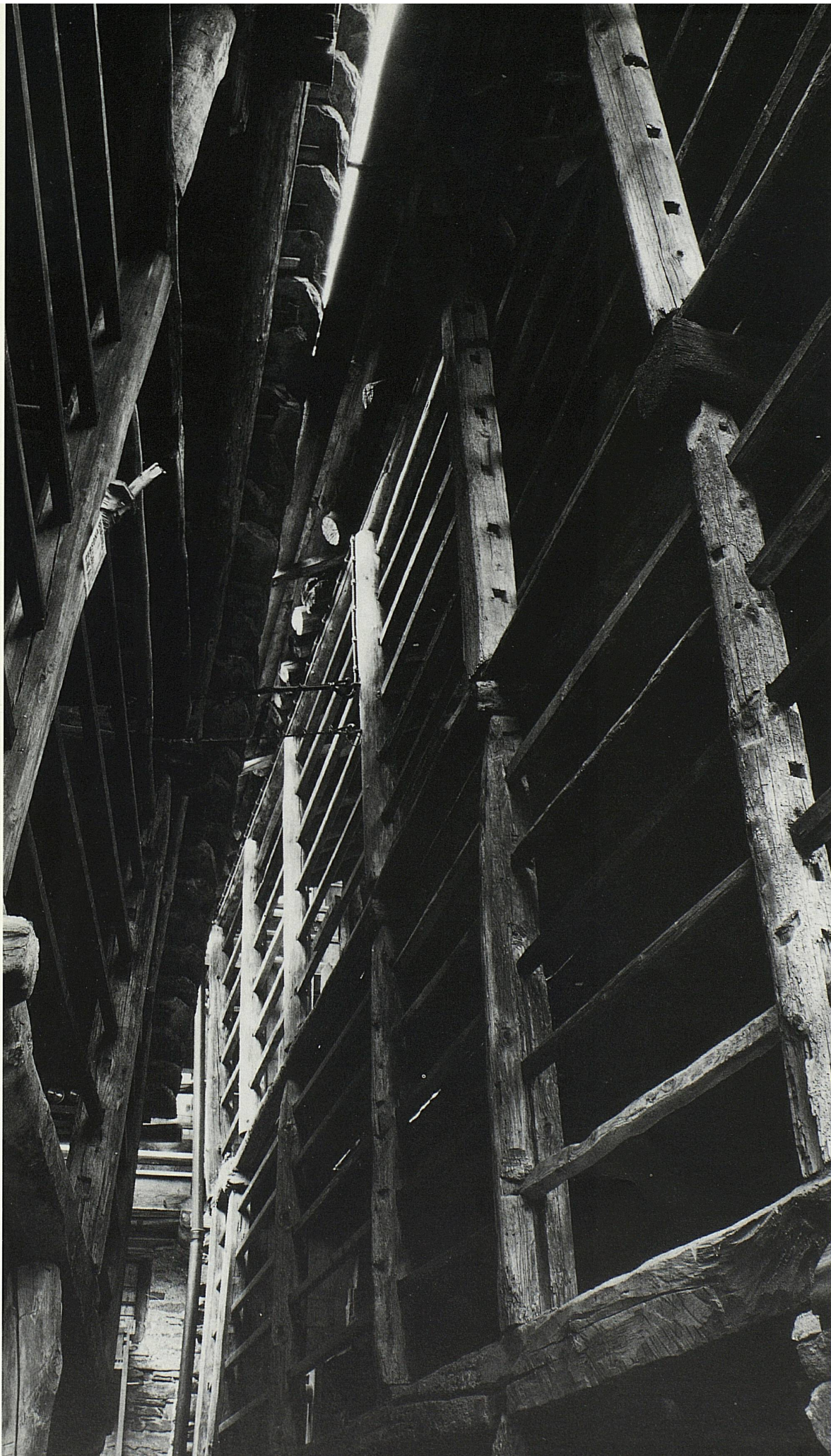
Cover: Heimischgartu, Saas. Frontispiece: Museum, Alagna-Valsesia