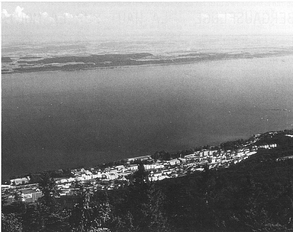
Blick vom Chaumont auf La Coudre am Neuenburgersee

Herbstzeit – Zeit für einen Städtebummel, zum Beispiel durch Neuenburg. Bei schönem Wetter darf dabei ein Ausflug auf den Chaumont, den Neuenburger Aussichtsberg, nicht fehlen. Seit