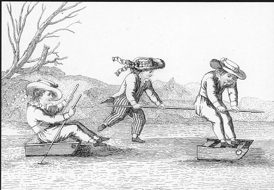
47/48 Illustrations du livre «Les jeux des jeunes garçons»: des enfants s'amuse avec de petits traîneaux en se servant de longues perches (gravures sur cuivre de Noël, Paris 1807)