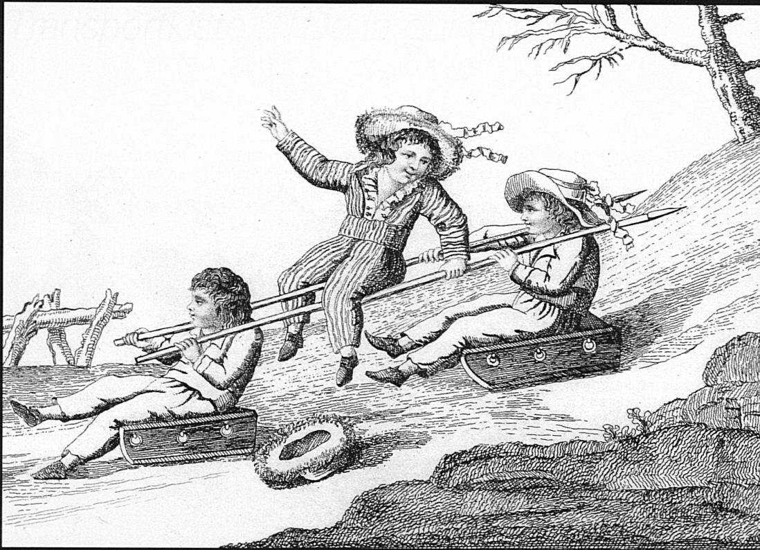
47/48 Illustrationen aus dem Buch «Les jeux des jeunes garçons»: Kinder vergnügen sich mit Schlittelspielen, als Hilfsmittel benutzen sie lange Stöcke (Kupfer-Radierungen von Noël, Paris 1807)