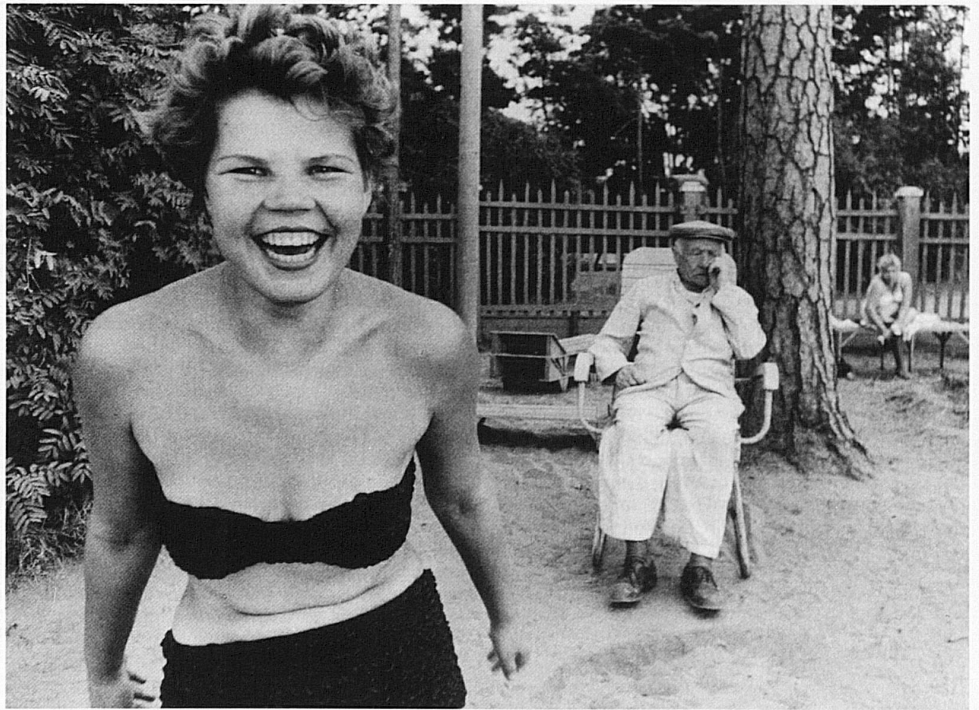
William Klein: Moscou, 1959

Gleich zwei grosse Namen der Schwarzweissfotografie sind derzeit im einzigen Fotomuseum der Schweiz zu sehen. Emanuel Rudnitzki alias Man Ray, der über die Malerei auf die Fotografie kam, war massgeblich daran beteiligt, dass die Fotografie als eigenständige Kunstrichtung anerkannt wurde. Für ihn war die Kamera ein zweischneidiges Schwert, mit dem er einerseits in die Wirklichkeit eindrang und andererseits Dinge und Motive der Realität entzog. Der Apparat kann, indem er den Moment aus seinem Zeitenfluss tötet, um ihn zu konservieren, ein Instrument der Wahrheit, aber auch des Todes sein. Der Apparat