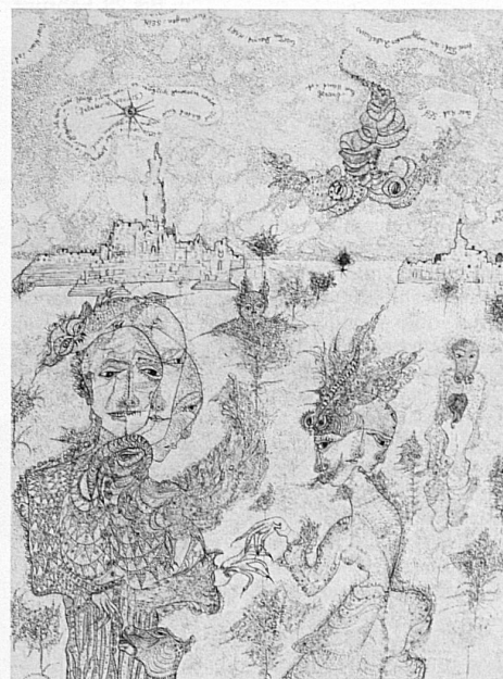
Unica Zürn: Bonjour Monsieur M.M. = MOM , 1960. Plume et mine de plomb, Collection Carl Laszlo, Bâle (exposition «La femme et le surréalisme», Musée des beaux arts, Lausanne)

Le thème de cette exposition renoue avec l'idée d'André Breton et de quelques autres surréalistes