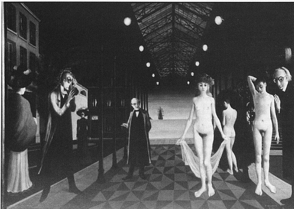
Paul Delvaux: Hommage à Jules Verne , 1971, huile sur toile