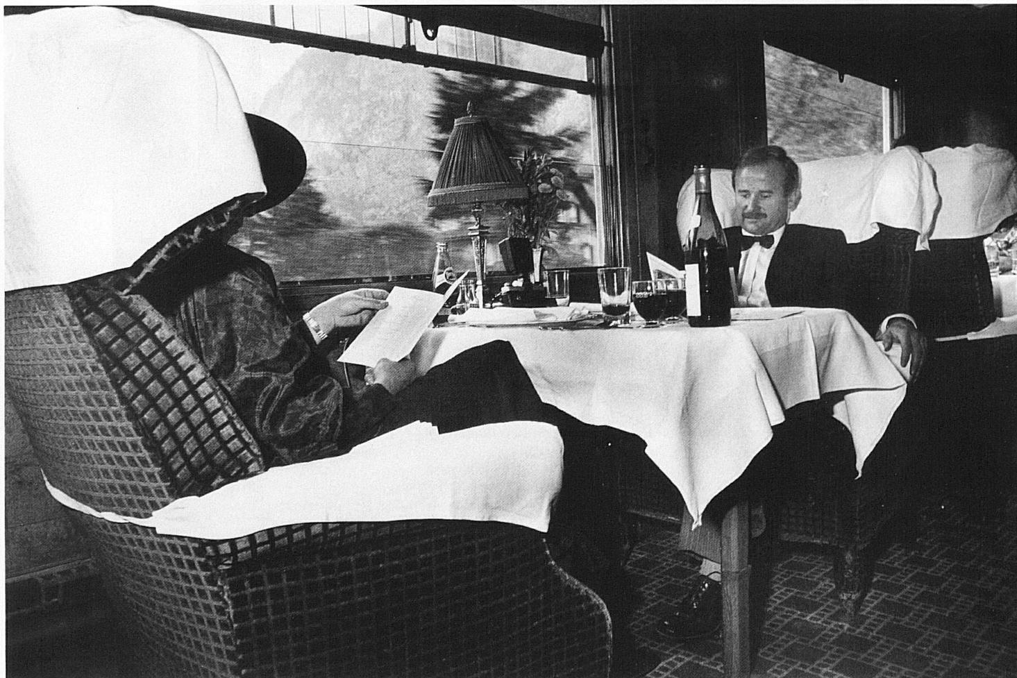
9/10 Immagini scattate durante un nostalgico viaggio con il Gotthard Pullman Express 9/10 Scenes from a nostalgic off-schedule journey in the Gotthard Pullman Express