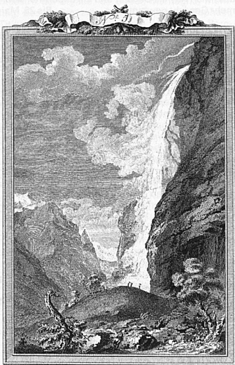
Lower Staubbach Falls

At a time when the Alps aroused fear and horror in the traveller, when they were regarded as anything but a literary subject, Albrecht von Haller wrote his philosophical didactic poem "Die Alpen", that "sublime song of the mountains" which was to give the first and strongest impetus for a radical change in perspective, and to pave