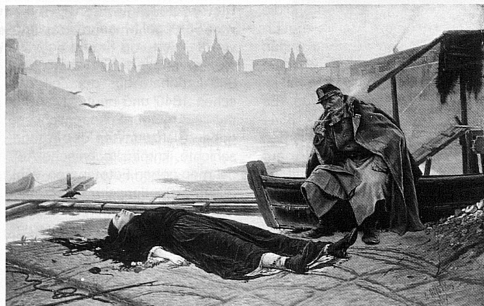
Russische Malerei im 19. Jahrhundert. «Die Ertrunkene» von Perow im Kunsthhaus Zürich

Das Kunsthhaus präsentiert eine Ausstellung über russische Malerei der zweiten Hälfte des 19. Jahrhunderts. Zu sehen sind 107 Gemälde von 48 Künstlern aus der Staatlichen Tretjakov-Galerie Moskau und dem Staatlichen Museum Leningrad. Während bei ähnlichen Ausstellungen bisher die russischen Leihgeber für die Auswahl verantwortlich waren, hatten die Verantwortlichen des Kunsthhauses diesmal – ganz im Zeichen von Glasnost – die Gelegenheit, selbst in die Depots zu steigen. Sie trafen zusammen mit ihren sowjetischen Kollegen eine Auswahl, die eine ganze Anzahl Bilder beinhaltet, die noch nie ausgestellt waren. Entstanden ist so eine Schau, die ein umfassendes Bild einer kurzen, aber kulturell vielfältigen Epoche zeigt. Die Stilrichtungen reichen vom Symbolismus über den Impressionismus bis zum Realismus, der für die spätere nachrevolutionäre Kunst entscheidend wurde. 3. Juni–30. Juli