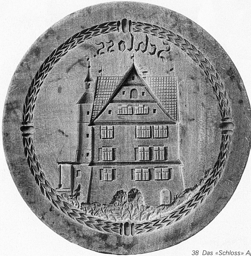
38 Das «Schloss» Appenzell

Ohne Holzmodel kein Appenzeller Biber! Nach traditionellen Vorgaben oder als Sonderanfertigung für besondere Anlässe schnitzt der Holzbildhauer kräftige Negativformen spiegelverkehrt in ein flaches Stück Birnbaumholz (42). Feinere Zeichen wie etwa beim Anis- oder Tonmodell sind für den Biberteig (43) ungeeignet. Diese Modelle sind zum Teil Jahrzehnte bei Bäckern, Konditoren und Hausfrauen in Gebrauch und werden, vor allem alte Stücke, auch als Wandschmuck verwendet