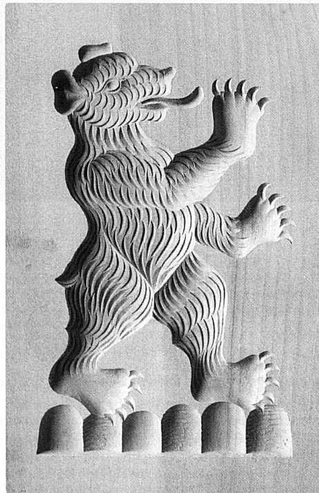
40 Der Appenzeller Bär (Wappentier)