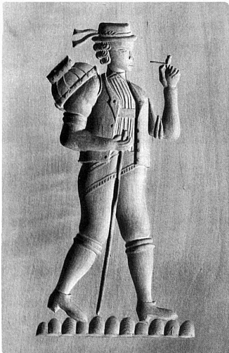
39 Appenzeller Senn mit Pfeife und Fahreimer

The "biber" of Appenzell, a kind of flat honey cake (46), is always made with wooden moulds. The wood carver cuts vigorous, mirror-image motifs in a pearwood board, either using traditional themes or creating a new design for a special occasion