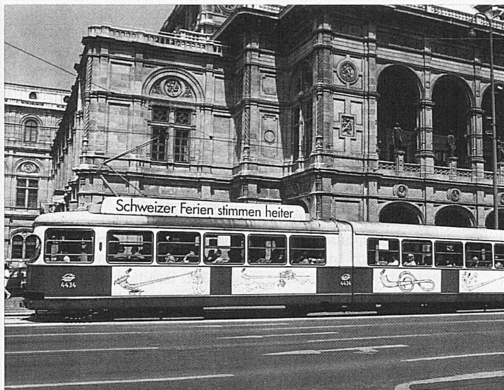
Zurzeit verkehren 10 Wagen der Wiener Strassenbahn – hier vor der Staatsoper – mit Werbung für das Ferienland Schweiz