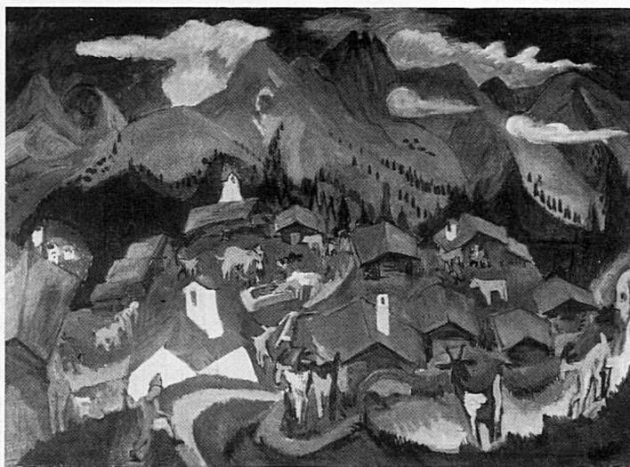
Rückkehr der Tiere – Stafelalp. Öl auf Leinwand. 1919

Die Ausstellung widmet sich der kurzen Schaffensperiode zwischen 1917 und 1923, den Jahren, in denen Kirchner in Davos, auf der Stafelalp und im Haus «In den Lärchen» in Frauenkirch gelebt und gearbeitet hat. Nachdem er aufgrund seiner physischen und psychischen Leiden bis zur Genesung aus dem Militärdienst entlassen worden war, reiste Kirchner zwecks Erholung nach Davos. In dieser Zeit lebte er fast ausschliesslich von Zigaretten, Alkohol und Veronal. Der Alldruck des Krieges und der Gedanke an eine erneute Rückkehr an die Front schienen ihn zu verzehren. Sein erster Aufenthalt in Da-