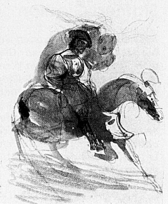
Delacroix: Der Connétable de Bourbon von seinem Gewissen verfolgt

Hans Holbein der Ältere scheint der erste Maler gewesen zu sein, der private Naturstudien für sich selbst gezeichnet hat, ohne Bezugnahme auf ein im Entstehen begriffenes oder in Auftrag stehendes Gemälde. Die individuelle Skizze bedeutete etwas völlig Neues, Gegensätzliches zum traditionellen «Musterbuch», das die Vorlagen für die Werkstatt enthielt. Auch Paul Cézannes Skizzenblöcke trugen rein privaten Charakter und waren nie zur Veröffentlichung bestimmt. Cézannes Kinder haben hineingezeichnet, er selbst hat die Blätter nie verkauft oder ausgestellt. Als sie etwa dreissig Jahre nach seinem Tod auf dem Kunstmarkt auftauchten, war Cézanne als Zeichner nahezu unbekannt. Dies ist denn auch der Charme der kleinen Basler Ausstellung. Sie zeigt den bald flüchtig, bald aus einer Laune heraus spontan