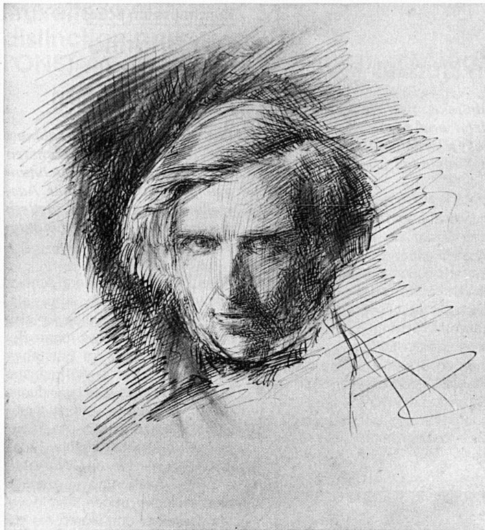
Ruskin stellte mehrere Selbstporträts her. Das Vorliegende stammt aus der Zeit, als sich der Schwerpunkt seiner beruflichen Laufbahn von der Kunst auf die Sozialwissenschaft und Nationalökonomie verlagerte