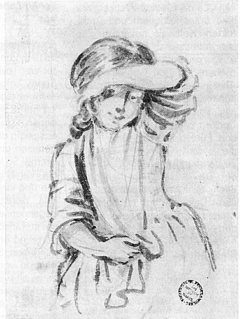
Sigmund Freudberger: Kleines Mädchen