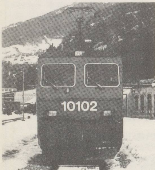
Lokomotiven und Triebwagen der Schweizer Bahnen Band 1: SBB. 1986 Edition. German. SFr 24.80/£11.00

Band 1 Schweizerische Bundesbahnen (SBB)