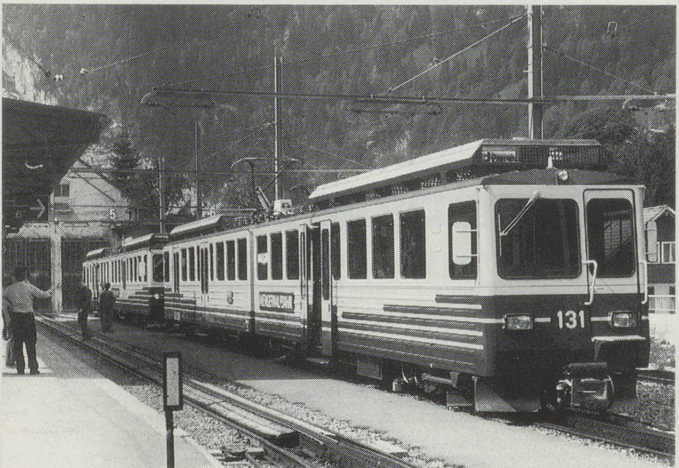
WAB. Triebwagens BDhe4/8. No.131 & 132 at Lauterbrunnen.

Lauterbrunnen - Wengen (Old route), Alpiglen - Grindelwald Grund. 25% Lauterbrunnen - Wengen (New route), Wengen via Kleine Scheidegg to Alpiglen. 19% All units fitted for multiple operation with or without driving trailer Bt. Line drawings and technical data supplied by S.L.M. Winterthur.