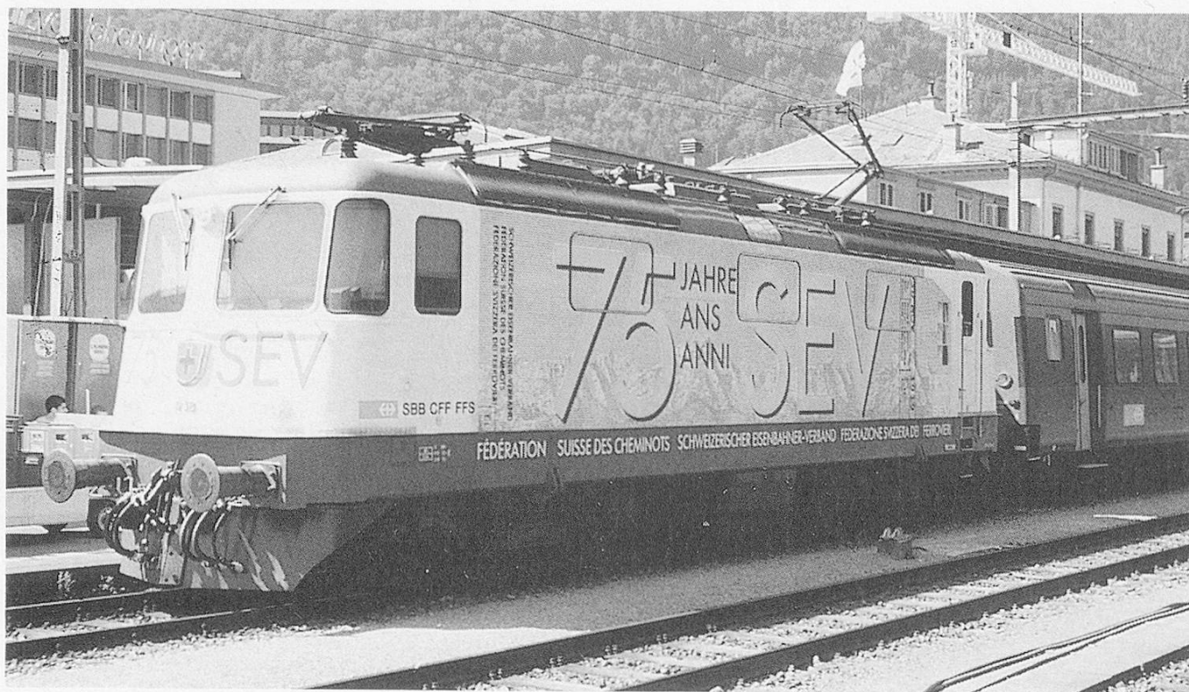
Re4/4 II 11238, in its special livery commemorating the 75th Anniversary of the Swiss Rail Union, SEV, seen at Chur on 2 July 1994.