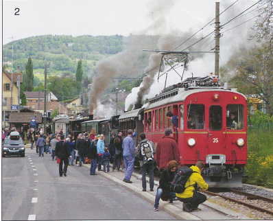
1. 523 032 at Sursee on 15th February 2013 working the RE3571 1206 Olten to Luzern. 2. Ex-RhB railcar Abe4/4 No. 35 leading the procession as every operable Blonay-Chamby steam loco and railcar, prepares to leave Blonay for Chamby and Chaulin. 20.05.13.