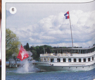
3. Interior of the Piano Bar of the Alpine Classic Pullman train. Photo: Richard Hawkins 4. This early 1900s postcard of the Gotthard line at Amsteg was found at a car-boot sale in Taunton. From the collection of Heidi Marriott. 5. Filling the sand box on a shiny new SOB emu - a bit of a contrast - brand new trains, state of the art, but you still need some good old sand! Photo: Keith Scotland 6. SS Simplon at the Parade Navale centred on Nyon, 19.05.13. Photo: Michael Farr 7. Ballenberg Dampfbahn's HG3/3 no. 1067 at Alpnachstad on Sunday 16th June 2013, hauling a special working between Alpnachstad and Brienz in connection with the 125th Anniversary of the opening of the SBB Brünig line. Photo: Richard Hawkins 8. Stuart Cooke spotted this novel dumper truck at Giswil on the ZB. Note the cunning method of track propulsion. 9. A Zentralbahn Bdeh 4/4 stands at Hergiswil. Photo: Stuart Cooke