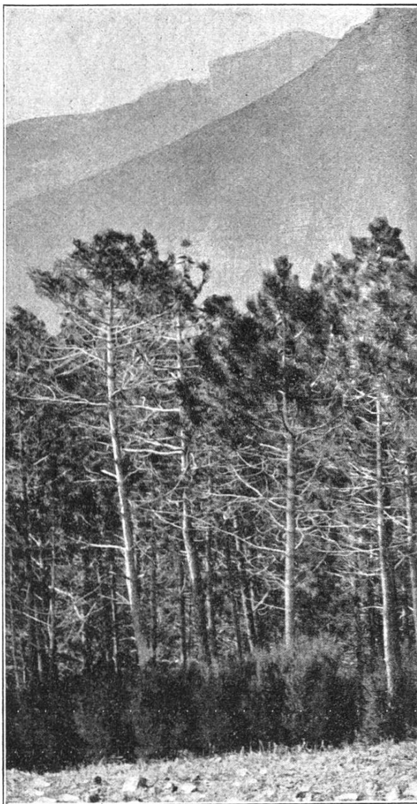
Peuplement et sous-bois au bord d'une tranchée garde-feu.

En outre, l'administration forme, durant les quatre mois d'été, une brigade ambulante composée de dix gardes, qui deux par deux, parcourent toute la région boisée au nord de l'Estérel. Ces patrouilles d'exploration ont des itinéraires fixés d'avance par le chef de cantonnement et ont pour tâche de surveiller les forêts communales et particulières, afin de signaler de très loin, les incendies qui prennent naissance dans ces forêts et qui pourraient menacer l'Estérel domanial. En août, qui est le mois le plus dangereux, on dédouble cette brigade et on rend la surveillance encore plus intensive en attribuant à chaque garde un ouvrier qui, en cas d'alerte, est chargé d'informer par téléphone ou télégraphe les agents forestiers et les autorités de la direction que prend un incendie. Pendant ce temps, le garde reste sur place et surveille les progrès du sinistre en attendant le secours.