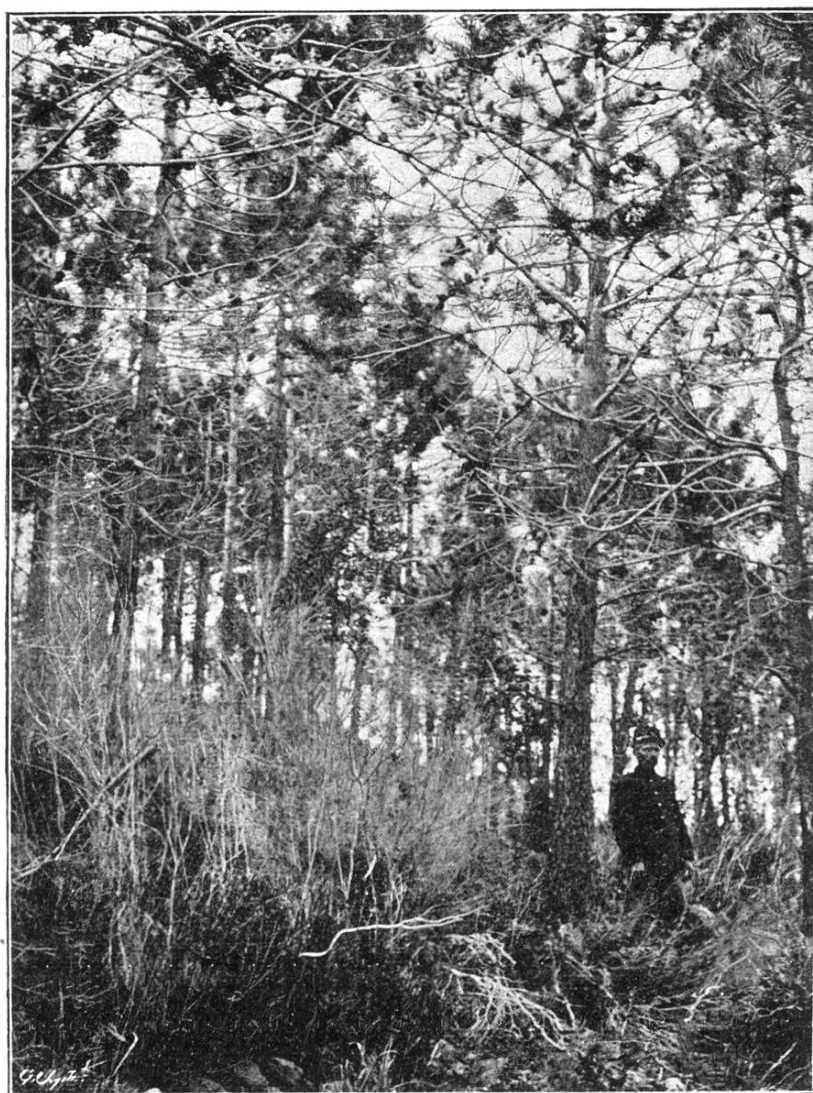
Peuplement avec sous-bois, 3 ans après le passage du „petit-feu.“

Nous avons eu l'occasion de voir au centre de l'Estérel une parcelle de plusieurs hectares de chêne liège pur, dont la broussaille était entièrement extraite sur de grandes surfaces. Les arbres d'âges différents semblaient alors former un verger infiniment moins dense qu'une plantation d'oliviers comme on en voit partout dans le midi de la France. Notons en passant que l'olivier ne