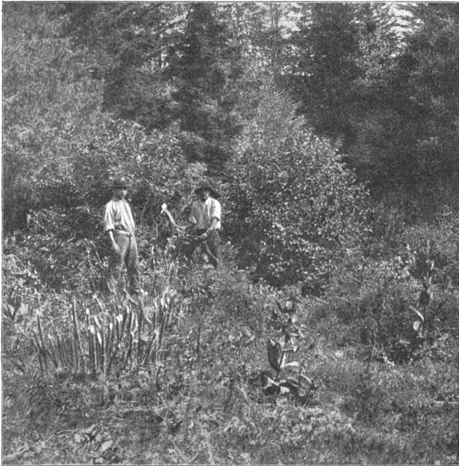
Préparations des buissons pour l'extirpation des bûches.

machine, manœuvrée par deux hommes, est posée sur la souche dont on a préalablement coupé les tiges; cette dernière, soulevée en l'air, est dépouillée de la terre attachée à ses racines. Celles-ci sont ensuite incinérées avec tout l'appareil aérien du coudrier, et les cendres qu'on en obtient sont répandues sur le sol après que les creux, occupés par les souches, ont été nivelés. Comme le noisetier renferme une forte proportion de chaux, on obtient ainsi une cul-