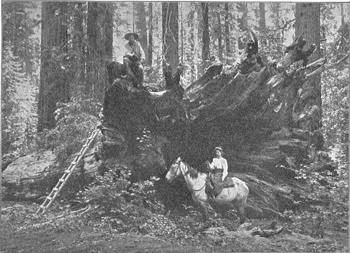
Fig. 1. Souche d'un Wellingtonia, Calaveras Hain, Californie.

Renseignements pris à bonne source, cette information s'est