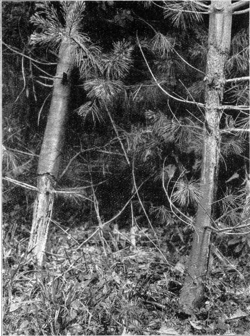
Fig. 2. Dommages causés sur le pin Weymouth par un rongeur (il s'agit probablement du campagnol roussâtre)

Les loirs, de mœurs nocturnes, sont représentés dans notre faune par diverses espèces. Nous signalerons en particulier le loir vulgaire ( Myoxus glis ), de la taille d'un petit écureuil, habitant en général les forêts. Puis le lérot commun ( Myoxus quercinus L.), de taille plus