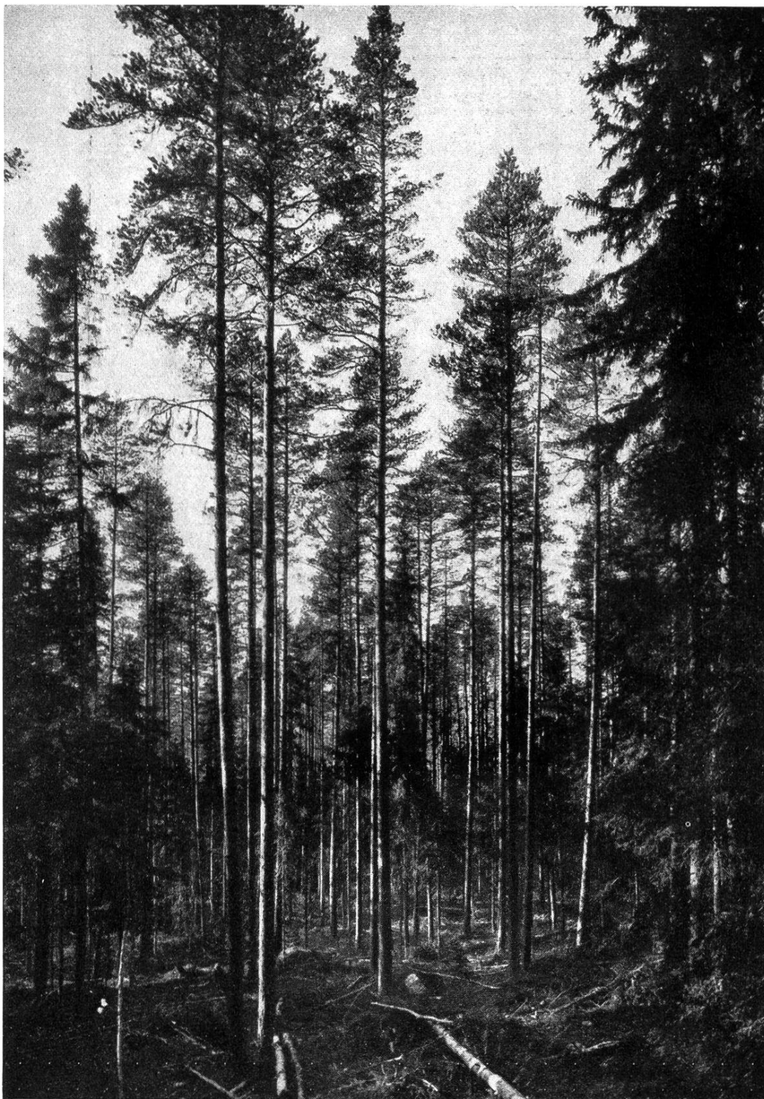
UNE FORÊT DE LA PROVINCE SUÉDOISE DU NORRLAND Partie de forêt élaguée à Norr-Edsta, appartenant à la société par actions de Kramfors