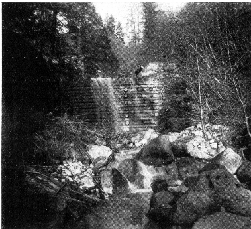
Vue d'un des barrages.

Les Travaux publics, le génie agricole et l'administration forestière participèrent à cette expertise.