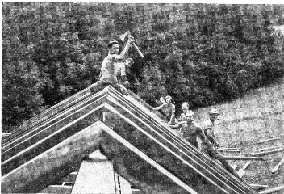
Construction, par un camp de travailleurs volontaires, d'un baraquement (à Niederweningen).

tous nos offices de travail sont unanimes à ce sujet : le service de travail en Suisse ne saurait prendre modèle sur ceux de l'étranger ; il doit chercher à remplir des buts sociaux, éthiques, nationaux et éducatifs, à côté de l'économique. La clause obligatoire ne concernerait que ceux qui n'ont pu trouver une occupation dans le service volontaire ou qui, à cause de leur situation financière, doivent recourir aux subsides pour chômeurs. Mais par cela, au lieu de développer le goût du travail qui, au point de vue social, doit être le but principal, on obtiendrait le contraire.