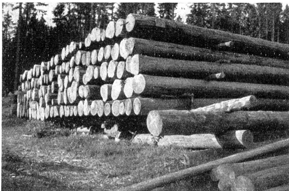
Phot. J. Barbey (sept. 1935).

Contre les échauffures, vitriolons leurs parements, sitôt après l'empilage, en employant une solution de sulfate de cuivre