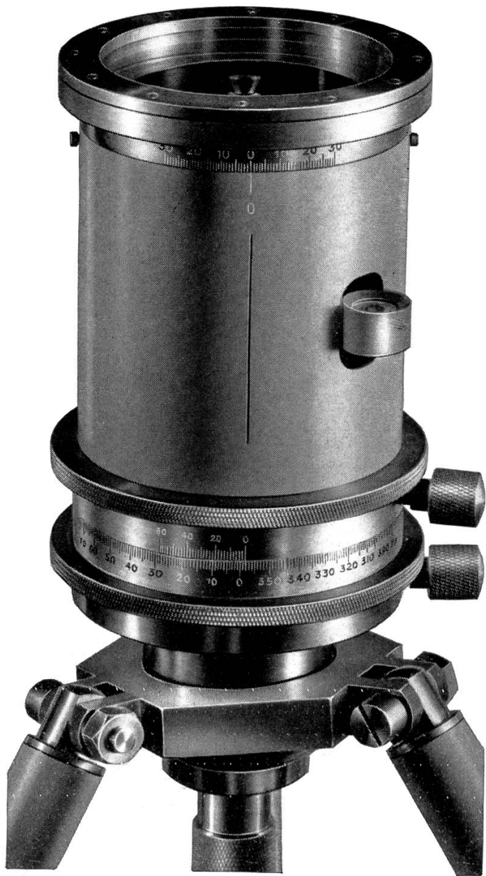
Environ \frac{2}{3} grand nat.

Pantomètre répétiteur avec boussole immergée et dispositif permettant de corriger la déclinaison.