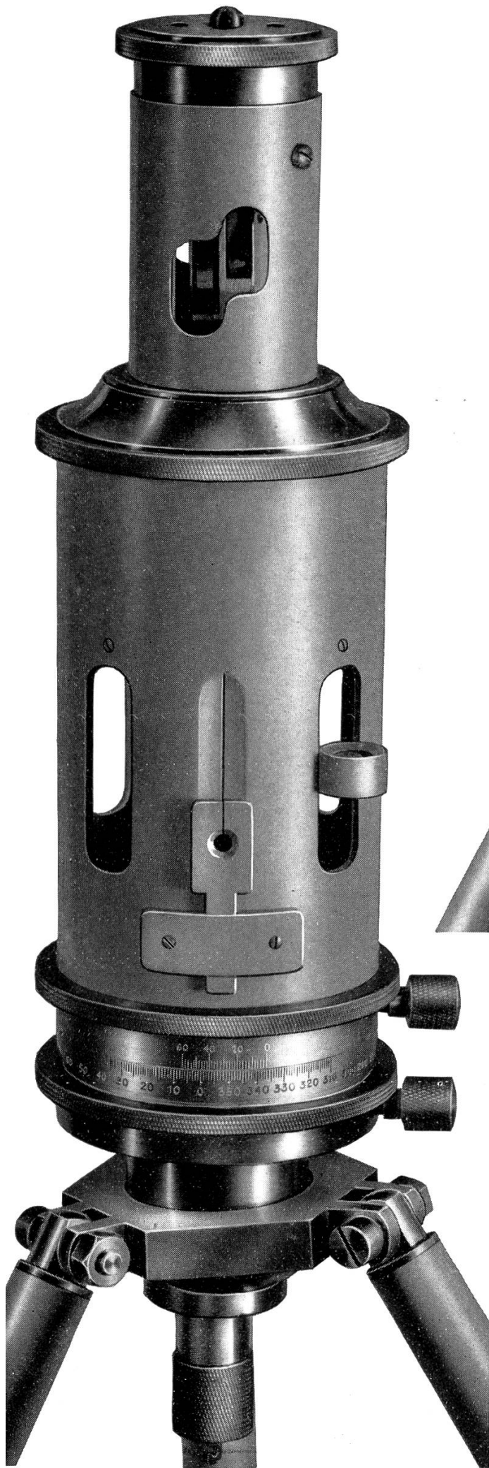
Environ \frac{2}{3} grand. nat.

Pantomètre répétiteur avec boussole immergée de 40 mm. placée dans le couvercle.