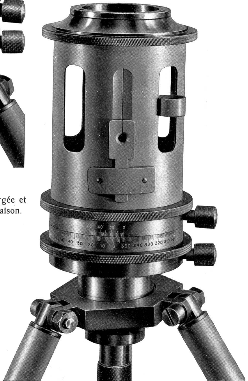
Environ \frac{2}{3} grand. nat.

Pantomètre répétiteur avec boussole immergée à disque; lecture au moyen d'un prisme grossissant, à \frac{1}{10}^{\circ} près.