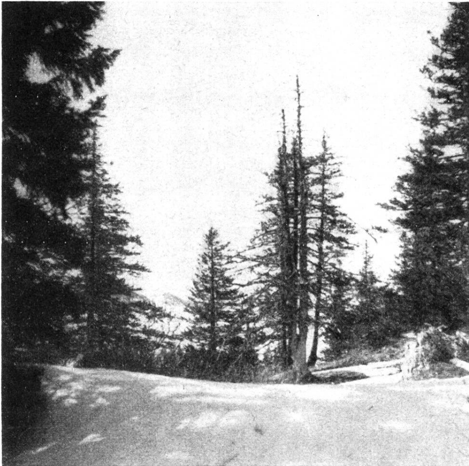
« Ici et là, un épicéa dresse son squelette de fantôme . . . »

Et si, pour compléter notre tour d'horizon, nous montons à l'est, du côté des Limes, nous trouvons, étagées sur un versant assez rapide, des plantations encore jeunes d'épicéas, de sapins et de pins, entrecoupées de peuplements de hêtres, qui se sont ensemencés naturellement sur les anciens parterres de coupes rases. Il y a même, à un