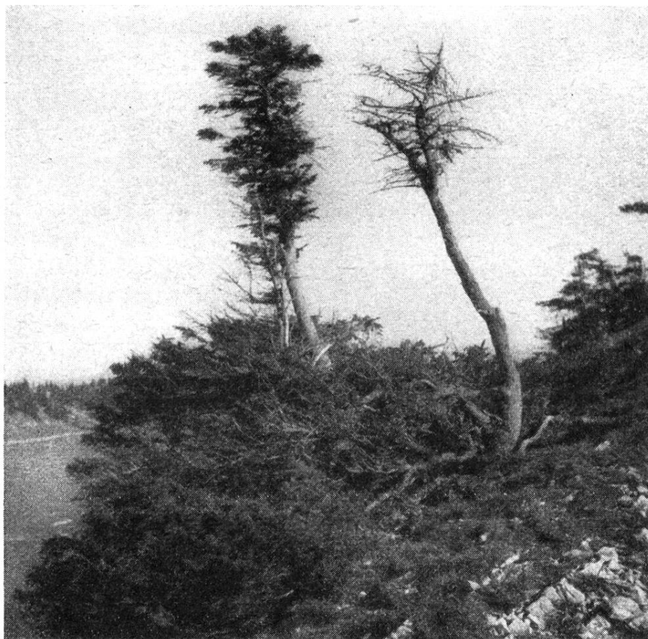
Vieux épicias aux prises avec les éléments; formation caractéristique de branches basses.

l'autre. Ici, la forêt perd ses droits. Sur les corniches, des buissons nous font signe : chèvrefeuilles, églantiers, amélanchiers, daphnés, cotonéasters, coronilles, etc. Dans les fentes du roc s'agrippe une flore aux riches couleurs, bellidiastres de Micheli, saxifrages faux-aizoon, androsaces lactées, aconits, spirées, mœhringies, gentianes, mulgédies, valérianes et, pour celui qui a du flair, les premières anémones à fleurs de narcisse et alpines et les sabots de Vénus.