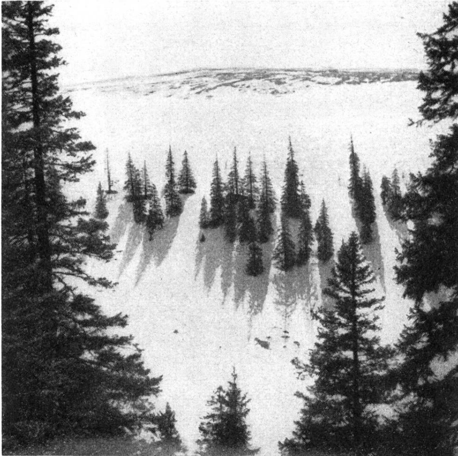
Derniers lambeaux de forêt sur la pente de Chasseral.

La plus grande partie des forêts fut exploitée autrefois par coupes rases; c'est la raison pour laquelle les futaies régulières d'épicéa et de hêtre dominant actuellement. Mais si nous nous éloignons un peu vers l'ouest, remontant le vallon qui mène à la Châtelaine, un sentier nous conduit à travers les restes d'une vieille sylvie naturelle, avec tout ce