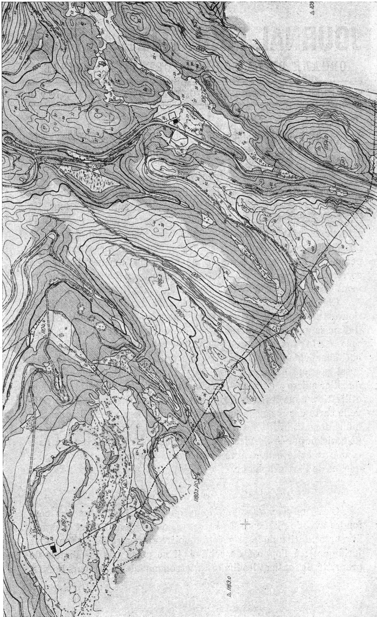
Extrait de la feuille N° 4 du plan d'ensemble de la mensuration cadastrale Vallorbe-Ballaigues. Région de la Roche des Arcs. C. N° 3087.