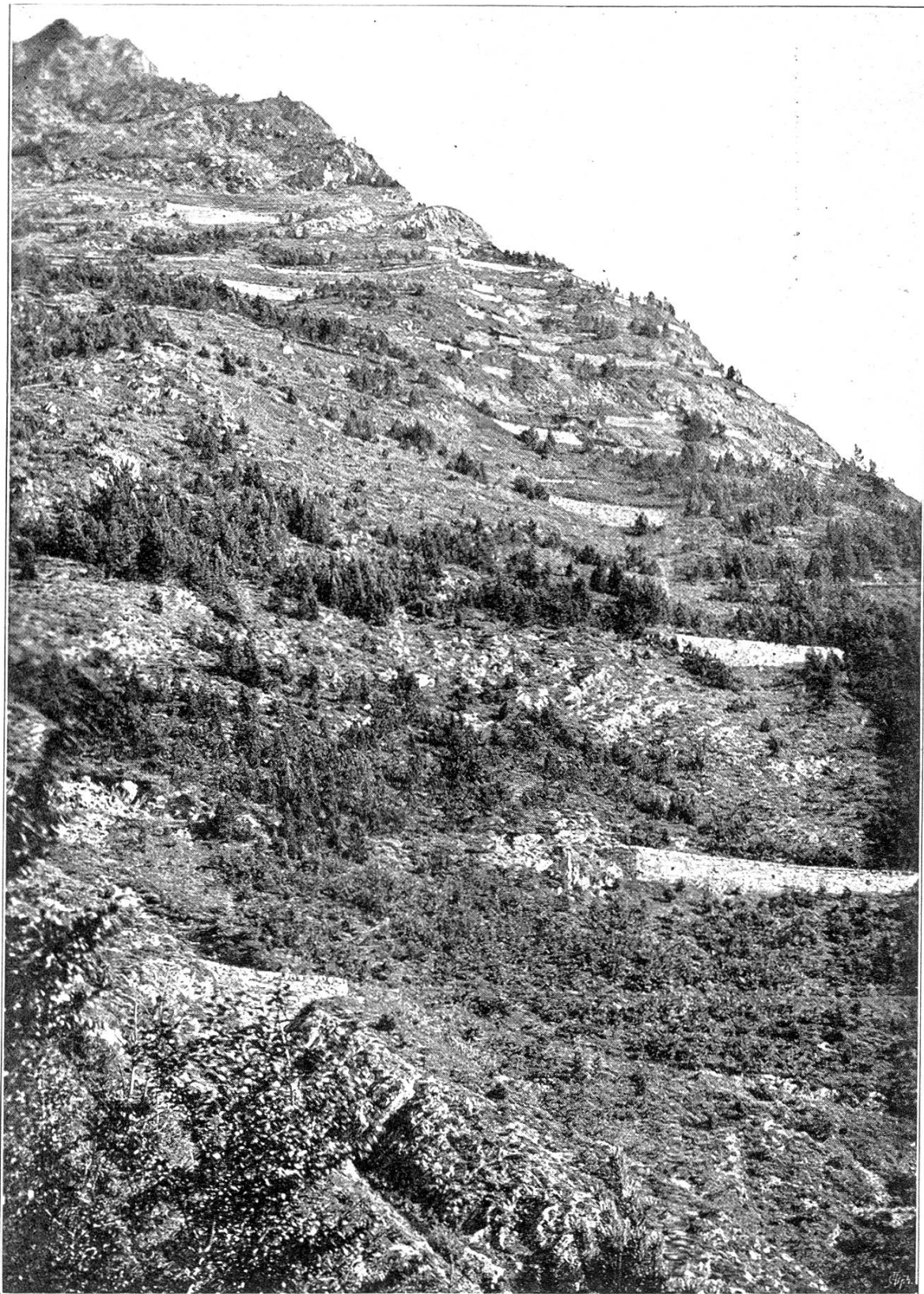
Lawinenverbau ob Barèges (Hoch-Pyrenäen). Banquettes contre les avalanches dans le ravin du Theil, près Barèges.