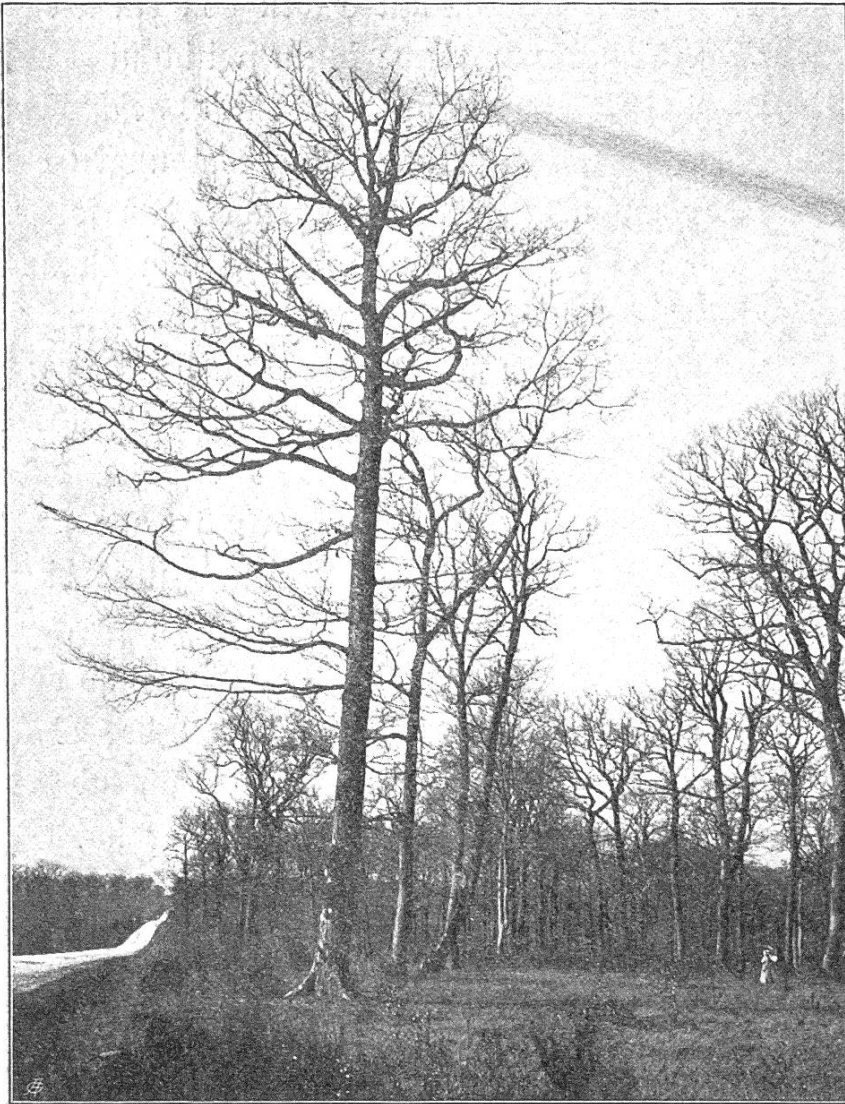
Staatswald von Dagnolet. Lichtschlag in altem Eichenhochwald.

Die Wirtschaftseinrichtung ist eine sehr einfache. Sie beruht auf der Einteilung der Waldungen in Periodenflächen (Affections), die je einer Periode von 20, 25, 30 Jahren zur Nutzung zugewiesen werden. Der Wald von Moladier z. B. ist in 6 Affections von je ca. 138 ha. eingeteilt, doch beträgt die Größe einer solchen Periodenfläche