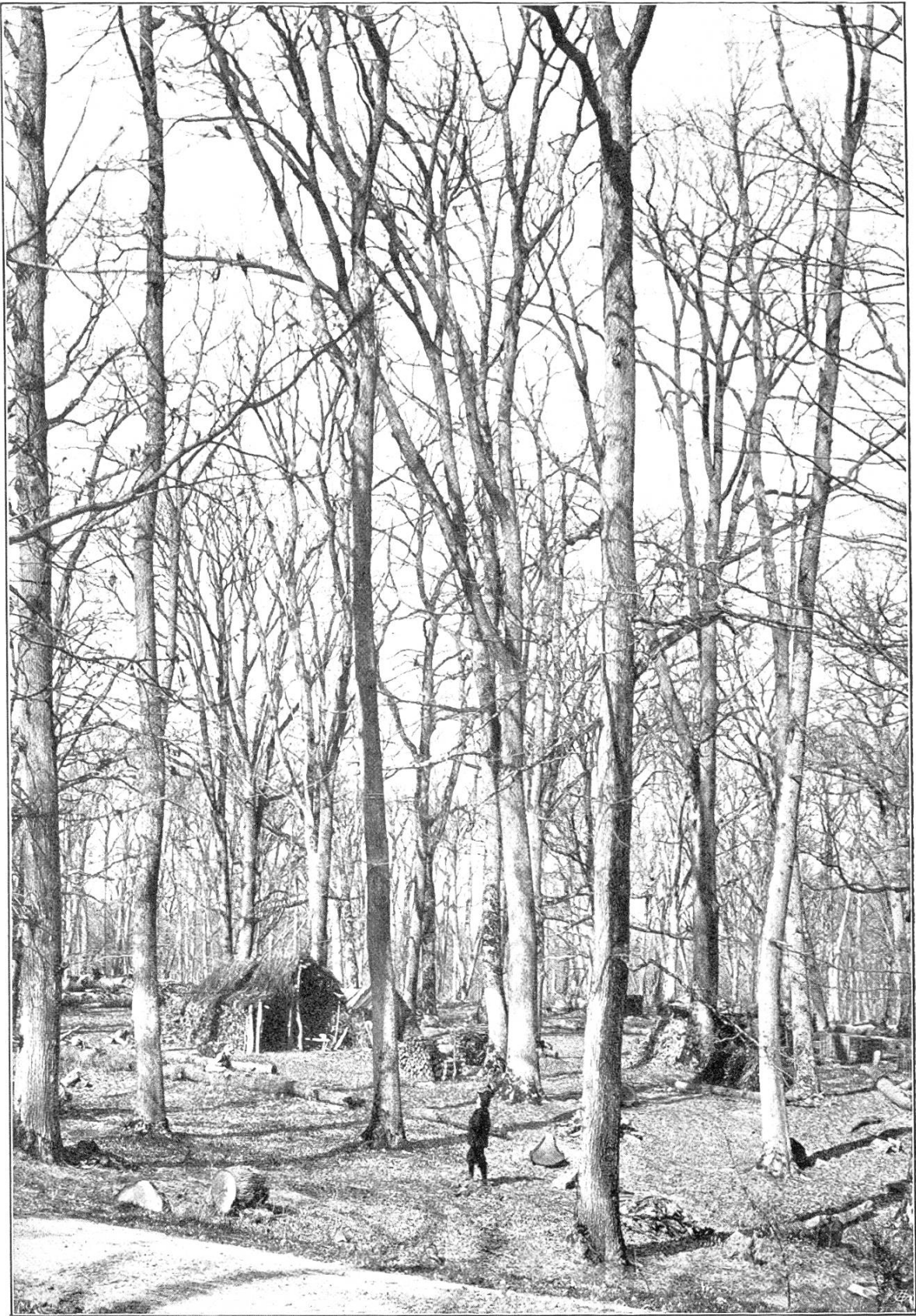
Staatswald Bois Plan. — Gemischter Hochwald von Eichen und Buchen in Ausbeutung. (Departement des Allier, Frankreich)