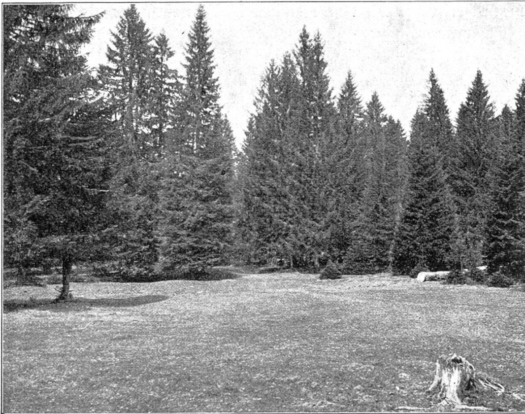
Wytweide mit gruppenweiser Bestockung.

Beide Arbeiten ernteten lebhaften Beifall. Die Diskussion wurde nur wenig benutzt und machte kaum neue Gesichtspunkte geltend, hingegen dürften die auf aufmerksamer Naturbeobachtung beruhenden, gründlich