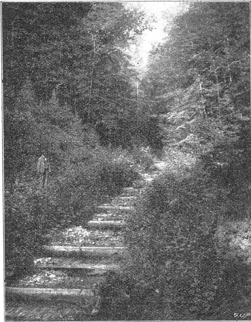
Verbau im Niedermattgraben.

zur Beruhigung von Schutthalden in gar vielen Fällen mit Erfolg anwendet, nämlich eine Flechtzaun-Anlage. Zum Teil wurden Eisenpfähle gebraucht, da hölzerne nicht in den Untergrund getrieben werden konnten. Diese Art der Verbauung hielt nicht Stand. Steinschlag und Rutschungen zertrümmerten das Werk. Letztere wurden in der Weise