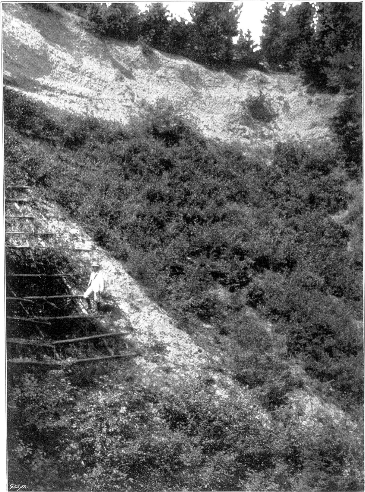
Verbau einer Schutthalde an der Blasensfluh (Emmenthal).