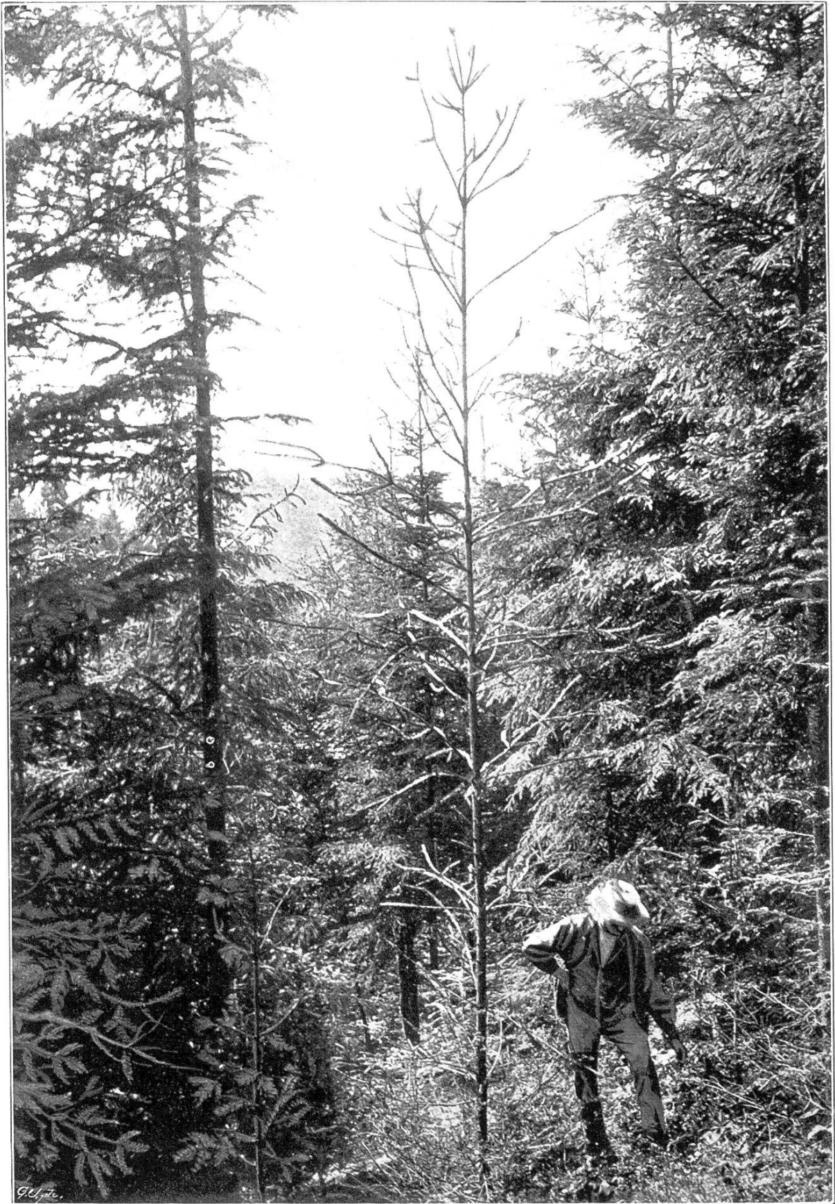
Die Schlangenfichte im Kalteneggwald.