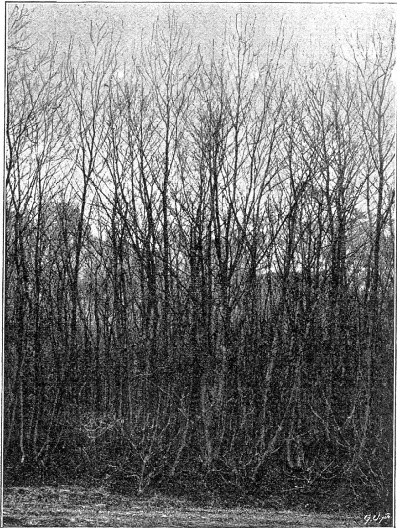
18—20jähriger Ersenbestand, hopfenfrei. War während der ersten zwei Jahre abgefriedet; von da an stark beweidet. Die Streu wird alljährlich sauber gemäht und das Laub gesammelt.

Eigentum der Rhein-Korrektion, welche mit großen Opfern die vielen Sand- und Kiesbänke durch Aufforstung mit Weißerlen in Bestockung brachte, außerdem aber auch höher gelegene Partien in Nadelholzhochwald umwandelte, welcher zur Zeit ein ganz vorzügliches Gedeihen aufweist.