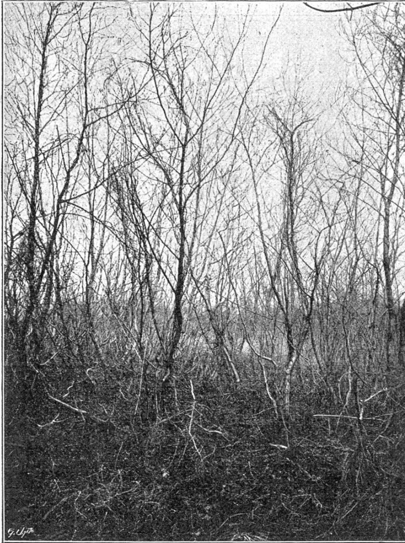
25jähriger Erlenbestand, in welchem weder Streu- noch Weidewirtschaft ausgeübt wurde, der aber in der Jugend stark unter wildem Hopfen litt.

Mit dem Fortschreiten der Rheinkorrektion, welche ihren Anfang