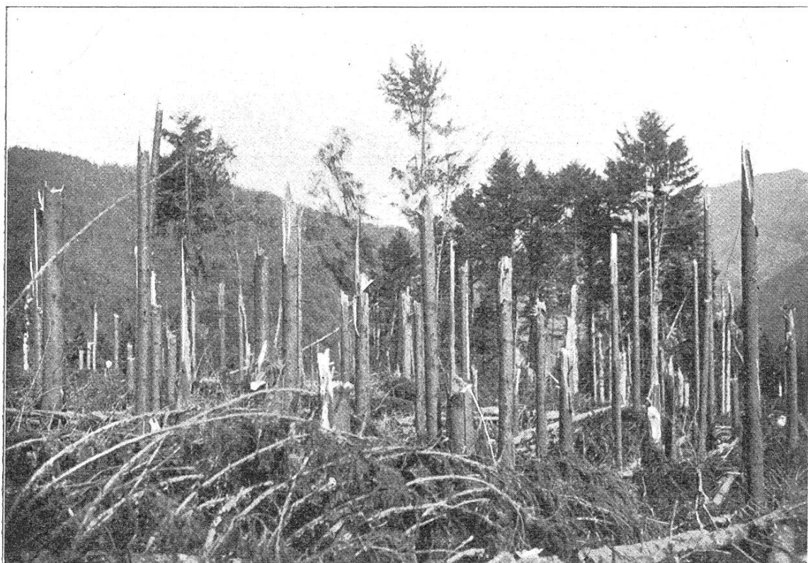
Fichten-Windbruch in der Oberförsterei Rothau, mit erhaltenen Buchen und Tannen.

Die Schäden, von denen im Hügelland und der Ebene die Fichte im reinen Bestand heimgesucht wird, bilden ein beinahe unerschöpfliches Thema und füllen in forstlichen Zeitschriften und Vereinsberichten Jahr für Jahr die Chronik der dem Walde zugestoßenen