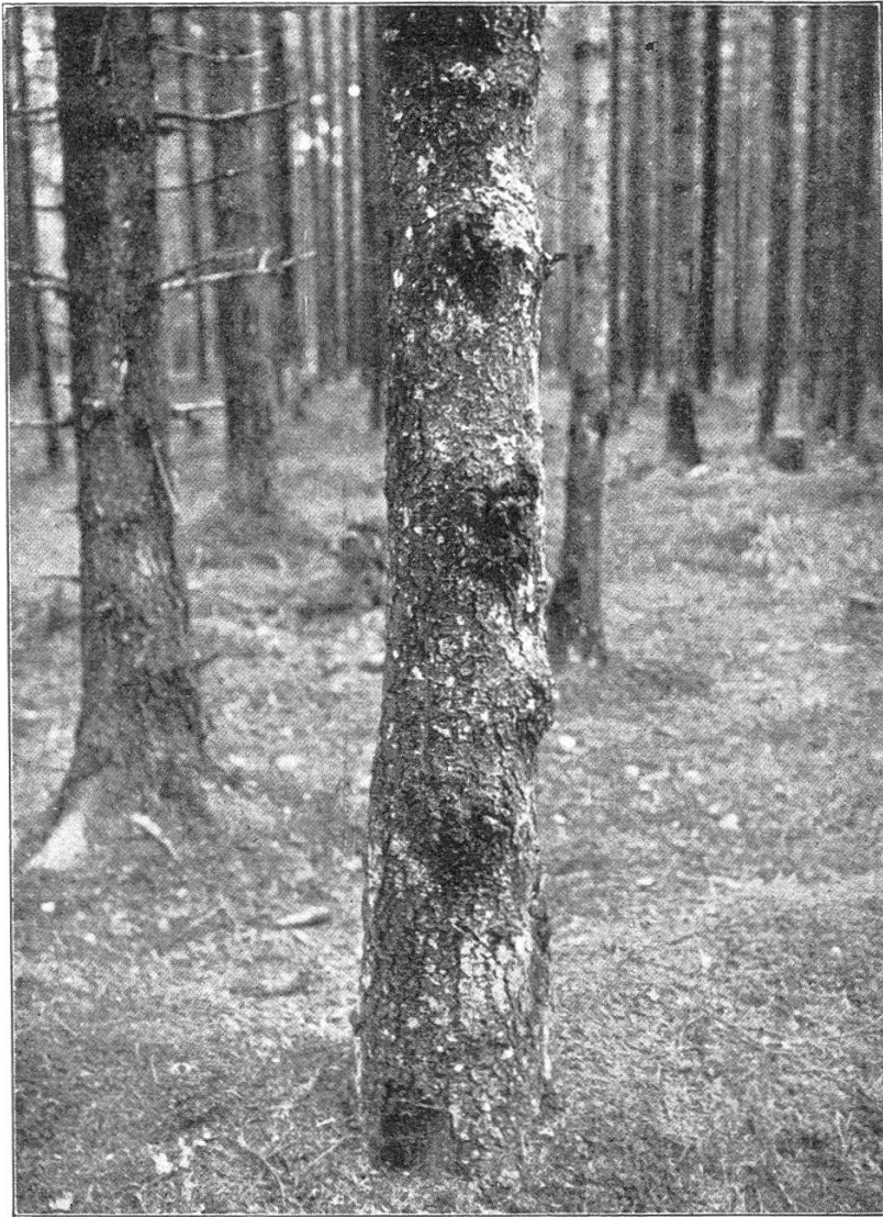
Fichte mit Krefwulsten an den Ansatzstellen der Äste.

In Fig. 1 ist eine (zirka 80 Jahre) alte Fichte dargestellt, die im unteren Stammteile an Stelle der abgebrochenen dürren Äste Wülste zeigt, welche ihre Entstehung der Einwirkung der Dasyscypha calyciformis verdanken. Die Sporen scheinen durch die absterbenden dürren Äste, die belassen wurden, Eingang in die Rinde gefunden zu haben. Ob Fäulnis