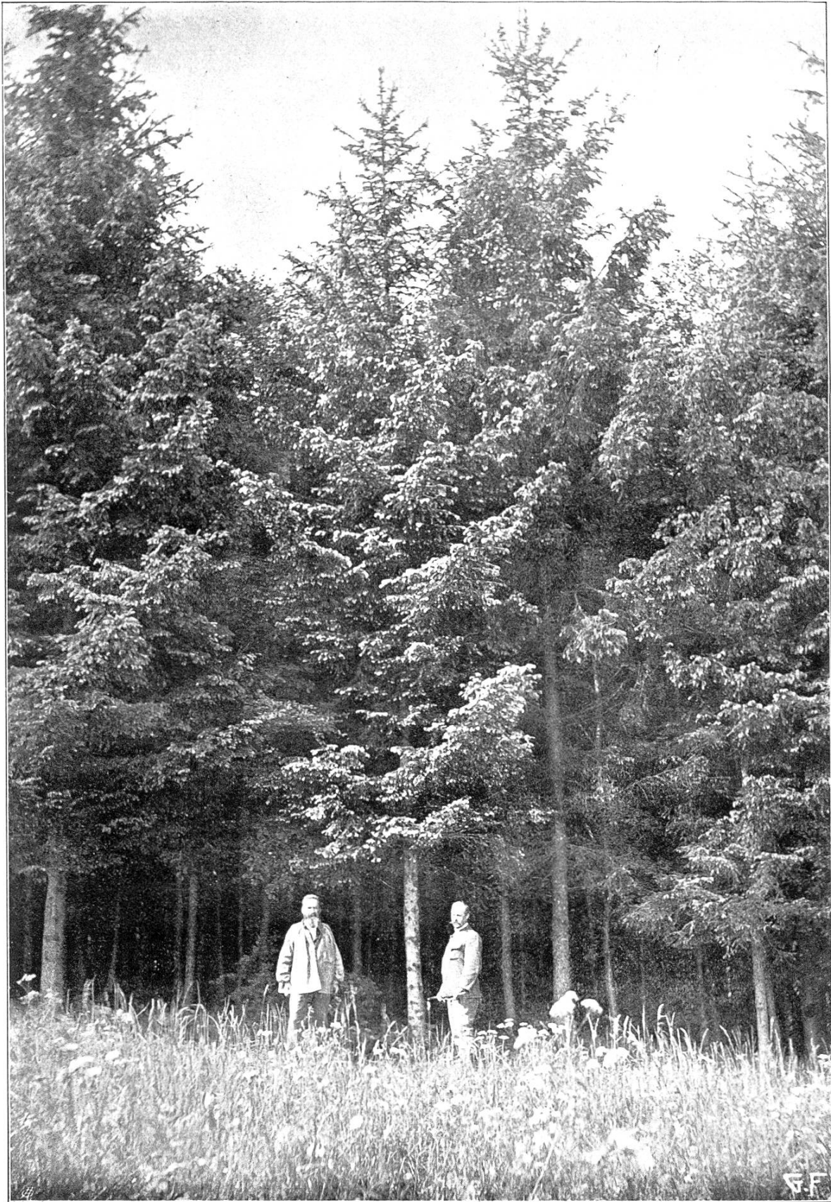
Die bleichsüchtige Fichte von Kirchleerau, Kanton Aargau.