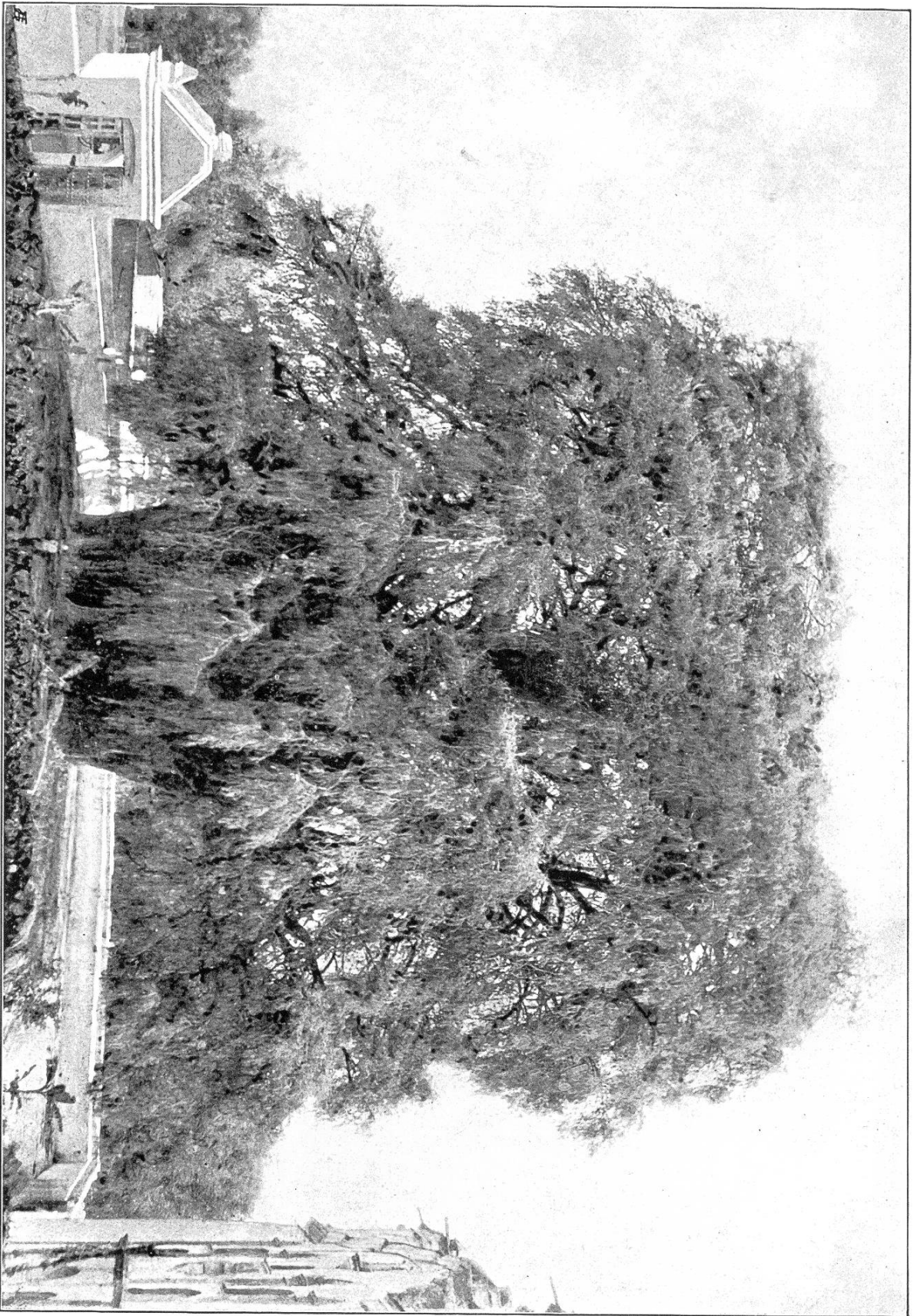
Die große Zypressen von Sule bei Daraca (Merito).