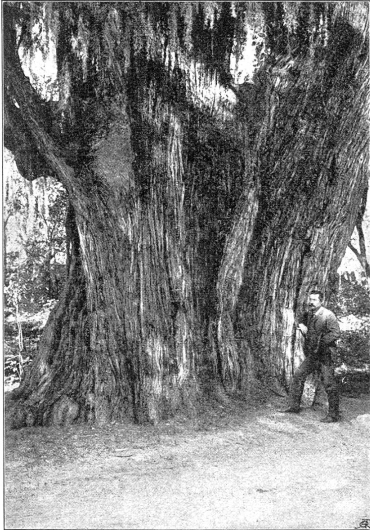
Stamm der Zypresse der Montezuma im Park zu Chapultepec.

auf nassen Stellen und in Flußniederungen. Nah verwandt mit der Sumpf-Zypresse ( Taxodium distichum ) des Südostens der Vereinigten Staaten, einer wegen ihres leichten und dauerhaften Holzes hochgeschätzten Spezies, gehört die mexikanische Zypresse zur nämlichen Sippe wie das Rotholz (redwood) und die berühmten Mammutsbäume der pazifischen Küste Nordamerikas. Obgleich überall auf der mexikanischen Hochebene