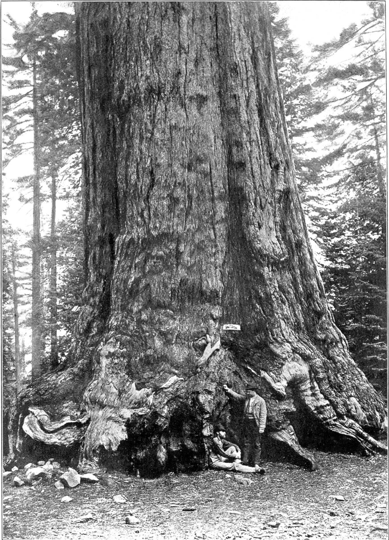
Der unterste Stammteil des Grizzli-Riesen im Mariposa Hain des Yosemite Nationalparks in Kalifornien.