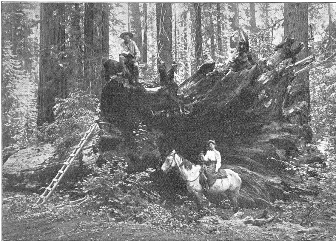
Fig. 1. Der Wurzelstock einer Wellingtonie im nördlichen Calaveras Hain, Kalifornien.

Bevölkerung von Kalifornien, und namentlich die 500 Frauen des „Kalifornia Klub“, haben mehr als neun Jahre lang gearbeitet, um die Regierung für jenen wunderbaren Hain der „Großen Bäume“ zu interessieren. Endlich sind im letzten Jahr ihre Bemühungen von Erfolg gekrönt worden; am 8. Februar 1909 hat Präsident Roosevelt eine bezügliche, vom Senat und vom Abgeordnetenhaus angenommene Bill unterzeichnet. Dieses Gesetz nimmt die Erwerbung des privaten Wellingtonien-Hains durch den Staat in Aussicht. Die Regierung stellte jedoch keine Vermittel zum Ankauf der „Big trees“ von Calaveras zur Verfügung,