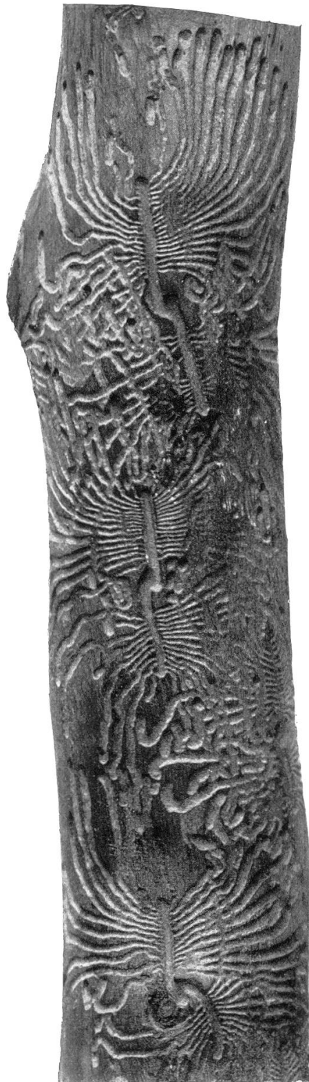
Fraß von Ptelobius vestitus auf der Pistazie ( Pistacia mutica ) Kaukasus.