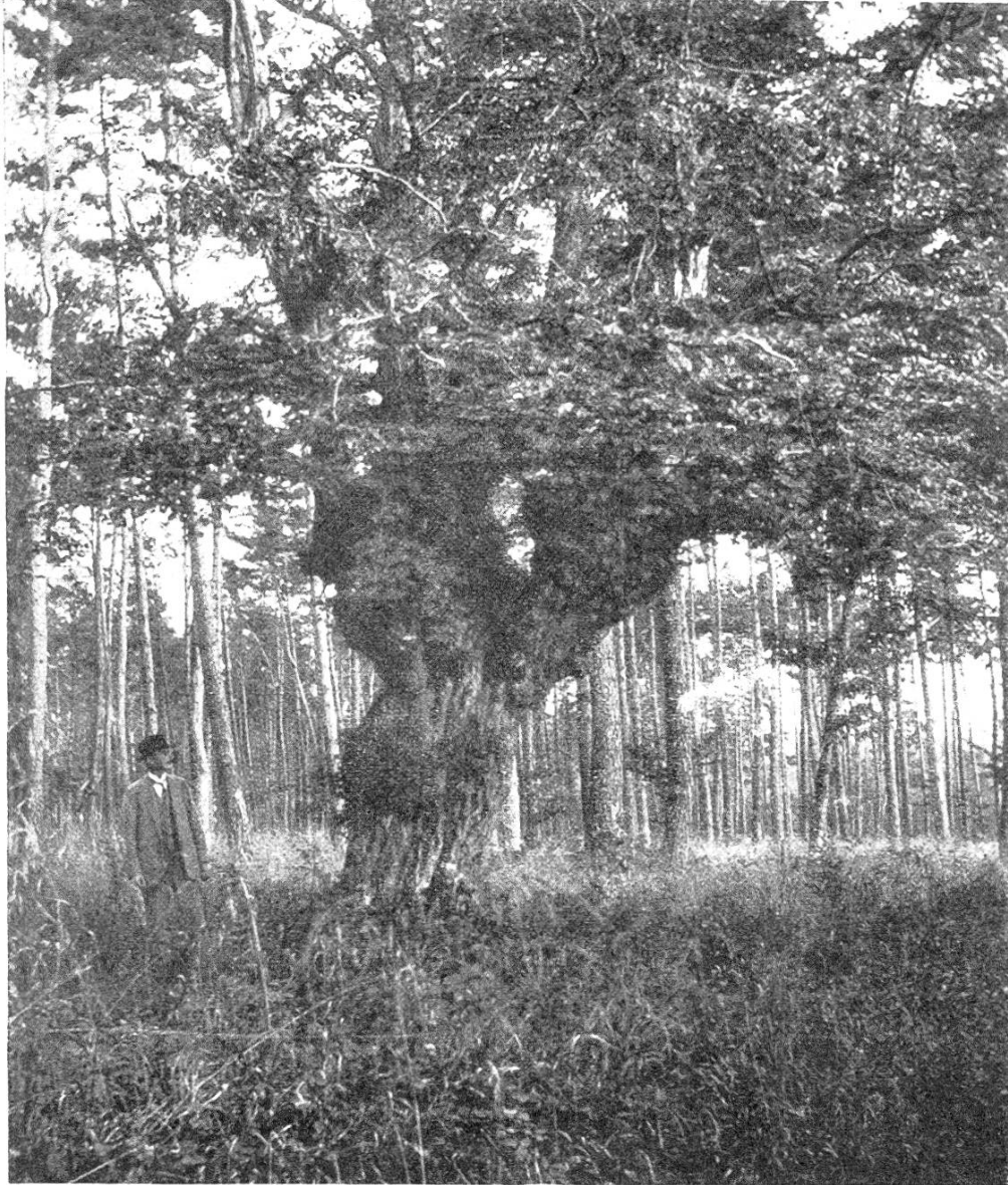
Hagebuche bei Liestal

Die Naturschutzkommission beider Basel hat daher an den Gemeinderat von Liestal das Gesuch gerichtet, es möchte der Baum als Naturdenkmal