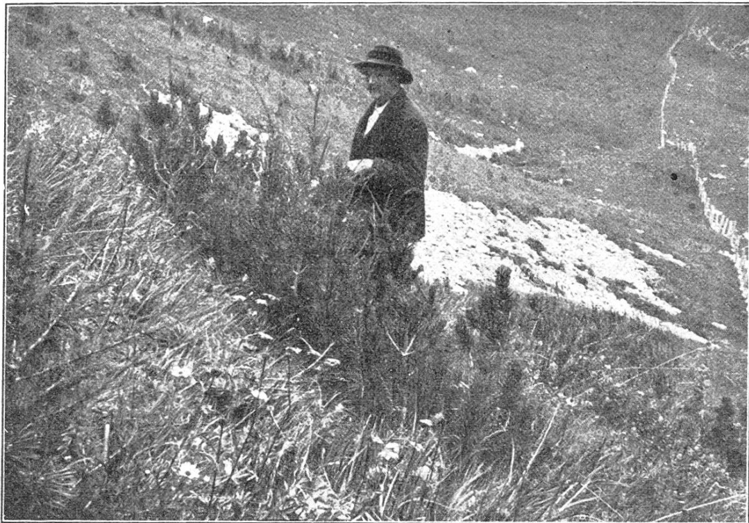
12jährige Lärchen- und Bergkiefern-Rinnenfaat.

Für größere Samen, wie z. B. solche der Arve und des Vogelbeerbaumes, ist die Stecksaat angezeigt, wobei mit dem horizontal in den Rasen eingestoßenen Segholz ein Loch angefertigt wird, das