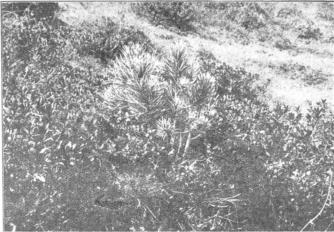
Arvenbüschel zwischen Alpenrosenstauden aus vom Tannhäher gesteckten Samen. Am Nordhang der Kleinen Scheidegg, Gemeinde Grindelwald, 2030 m ü. M.

Von allen diesen Kalamitäten bleiben die Sämlinge auf be- rastem Boden verschont. Sie genießen den Schutz des Grases, ohne