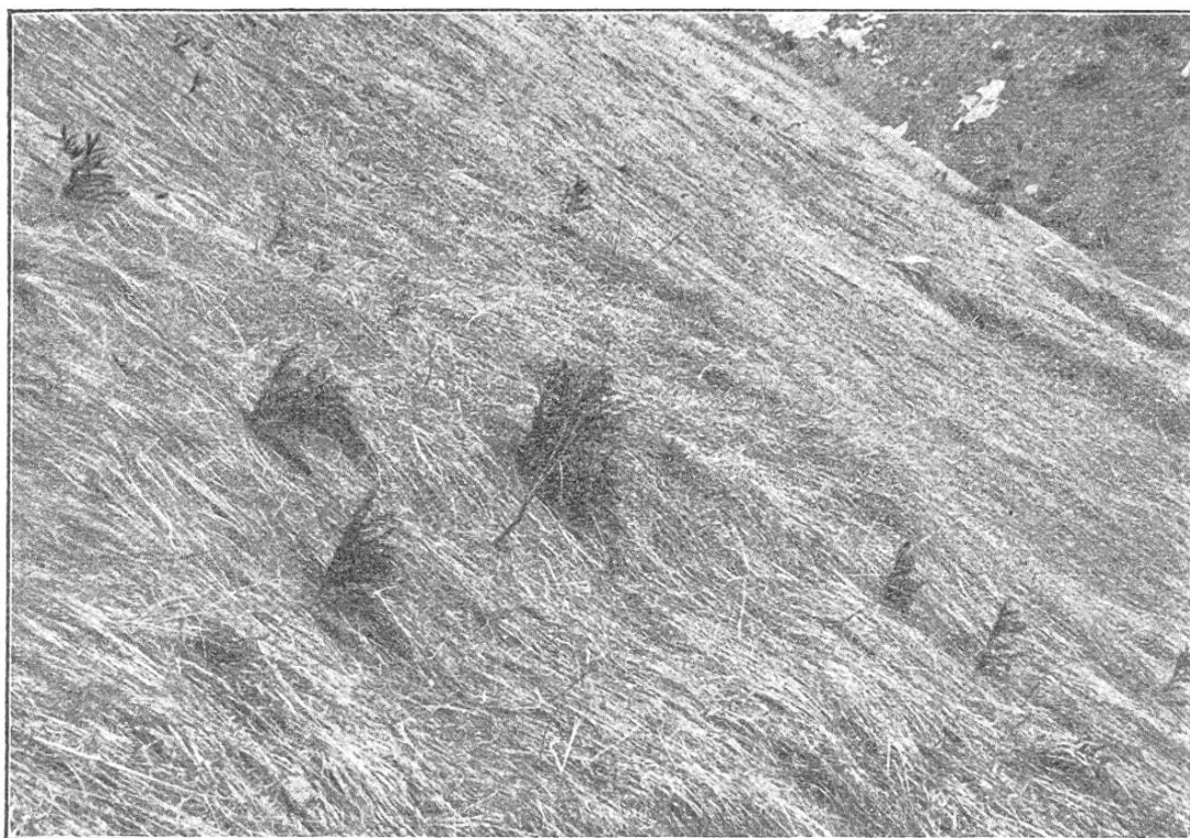
Fichten-Naturanflug aus verſchiedenen Jahren in vom „Sueggischnee“ „gekämmtem“ Raſen, der ſeit 10 Jahren nicht mehr gemäht wurde.

Längenwachstum ab, bevor die verdämmende Wirkung des Graſes ſich ſtark geltend macht und gehen ſomit faſt ungehindert in die Höhe. Im Winter werden die Pflänzlinge allerdings mit dem Graſ vom Schnee zu Boden gedrückt, nehmen aber dadurch keinen Schaden, ſondern richten ſich im Frühjahr einfach wieder auf. Beſonders leicht macht ſich dies am Hang, wo die langſam talwärts gleitende Schneedecke, der ſog. „Sueggischnee“ oder kriechende Schnee, den Raſen ſo ſorgfältig kämmt, daß genau Halm an Halm in der Richtung des