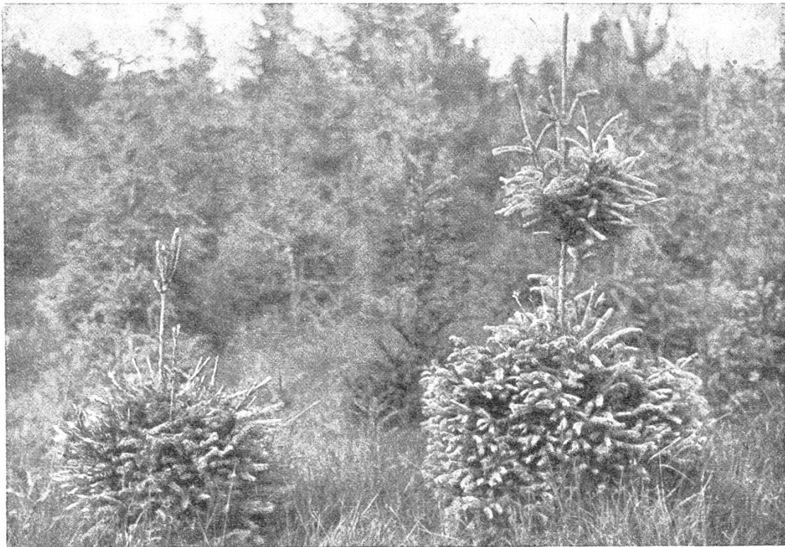
Abb. 3. Fichten im Frostloch.

Es fällt auf, daß, je ausgesprochener die Frostlage ist, die Fichte sich um so mehr auf den Kampf mit dem Frost einstellt. In Zone I richtet die Fichte in der Mehrzahl der Fälle nach Verlust der Krone nicht nur die obersten noch unversehrten Seiten- und Zwischenwirtelzweige, sondern häufig auch noch diejenigen von 1—2 früheren Jahrgängen auf und formt sie zu Gipfeltrieben um. Es ist als ob die ganze Intelligenz der Pflanze sich auf Abwehr der Angriffe des Frostes einstellte: alle Organe werden so geformt und gestellt, daß sie unter ge-