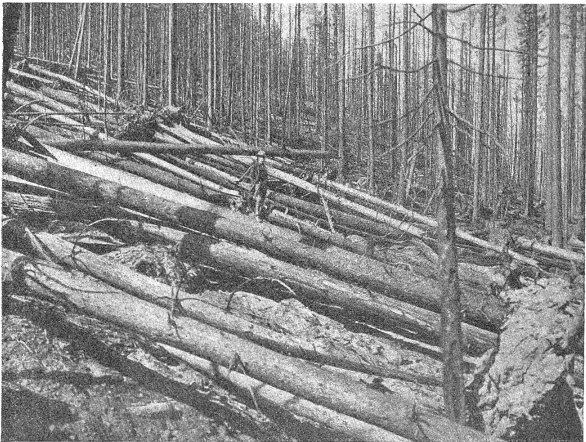
Durch Feuer zerstörter Wald

geschützt werden zu können, während der ganzen Tageszeit unter Beobachtung stehen, d. h. im Sommer durch volle 15 bis 16 Stunden. Ein Streifaeroplan kann aber täglich nur zwei Flüge von zwei- bis dreistündiger Dauer ausführen; die Maximalzeit, während welcher irgend ein Waldteil unter Kontrolle steht, ist daher knapp eine halbe Stunde während jeden Fluges oder eine Stunde per Tag. Während der übrigen Tageszeit ist daher keine Möglichkeit gegeben, einen etwa