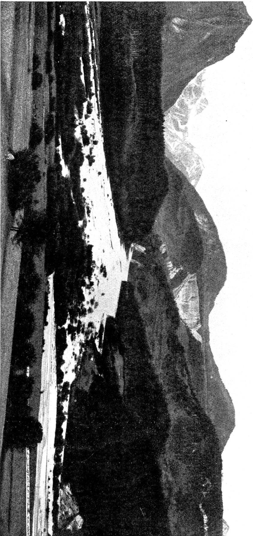
Abb. 1. Schafatobel mit Schuttkegel, von Bludenz aus gesehen Im Sintergrund links Seealpiana, rechts Schillertopf