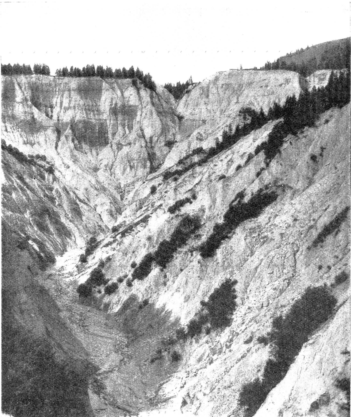
Abb. 3. Blick in das Schesatobel vor der Verbauung, unmittelbar nach einem starken Murgange

Der Unter- und Mittellauf des Tobels wiesen vor der Verbauung ein Gefälle von 30—40 %, der Oberlauf ein solches von 40—70 % mit Abstürzen und Wasserfällen auf. Aus allen Seitenrinnen kam das Material schlammartig gelaufen, den Hauptstrom im Tobel ständig vergrößernd, so daß er oft mit einer Mächtigkeit von 20 und mehr Metern die Länge des Hauptgrabens von rund 1100 m in 1\frac{1}{2} Minuten durchlief.