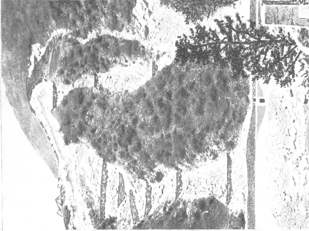
Abb. 7 u. 8. Aufstiegungen bei Melera, 900—1000 m ü. M. Aufnahme 1915