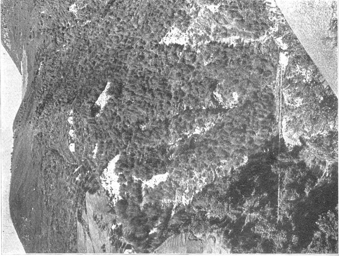
Abb. 7 u. 8. Aufstiegungen bei Melera, 900—1000 m ü. M. Aufnahme 1924